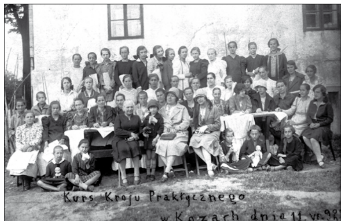
Ochronka – kurs kroju praktycznego – 1929 r.

W tekście autor wykorzystał m.in. publikację A. Zubra „Fototeka – Kronika Kóz w obrazach”.