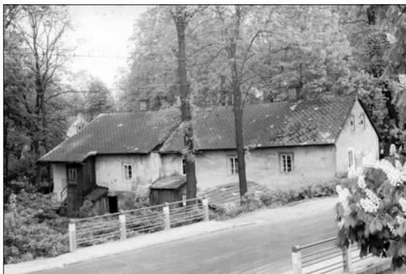
Ochronka w 1968 r.

Starania czulej na chłopską biedę pani baronowej trwały kilka lat, zanim udało się jej sprowadzić z Kęt do Kóz siostry zakonne ze Zgromadzenia Zmartwychwstania Pańskiego.