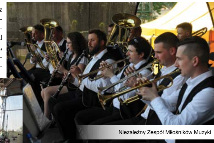
Niezależny Zespół Miłośników Muzyki