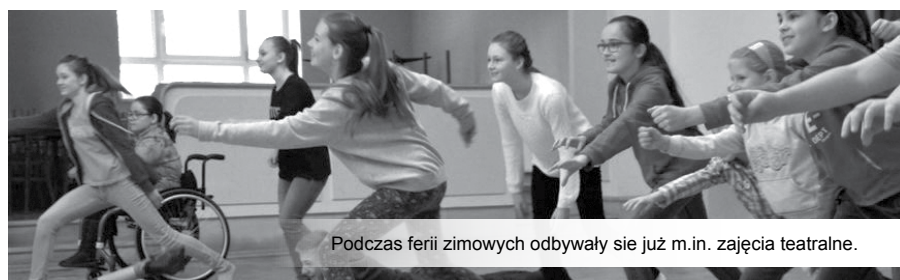
Podczas ferii zimowych odbywały się już m.in. zajęcia teatralne.