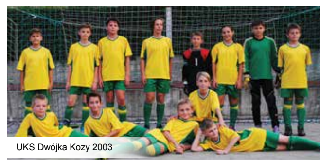
UKS Dwójka Kozy 2003