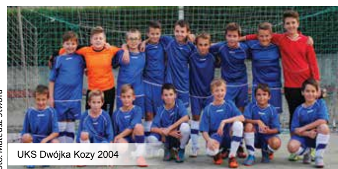
UKS Dwójka Kozy 2004