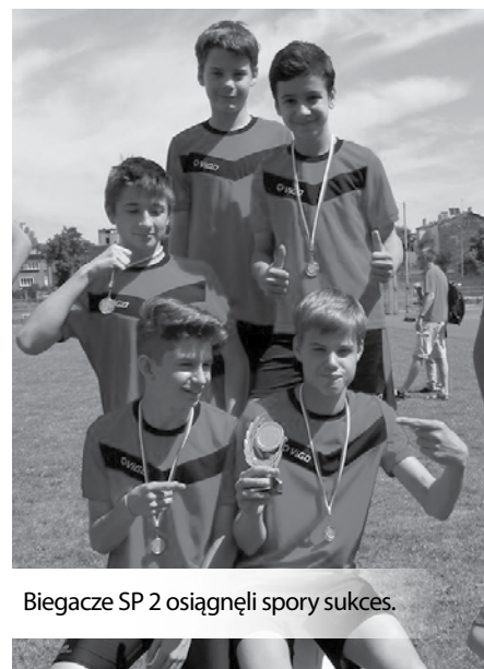
Biegacze SP 2 osiągnęli spory sukces.