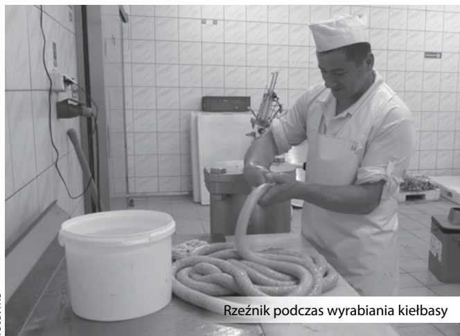
Rzeźnik podczas wyrabiania kielbasy

A o tym, że produkty „pod szyldem” Kapecki Sp. J. mają swoją markę, przekonują się już nie tylko konsumenci. W ostatnim czasie koziańska rzeźnia dwukrotnie została wyróżniona na arenie ogólnopolskiej. – Byliśmy nominowani w konkursie Orzeł Agrobiznesu w Warszawie, sukcesem za-