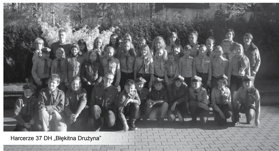
Harcerze 37 DH „Błękitna Drużyna”

3 grudnia drużyna 37 DH po raz piątnasty rozpoczęła zadanie „Czekoladowe Życzenia” – polega na zbieraniu czekolad, które następnie z życzeniami świątecznymi trafią do podopiecznych Domu Dziecka z Bielska-Białej i ludzi samotnych i chorych z Kóz. Akcja prowadzona będzie w koziańskich szkołach i podczas harcerskiej wigilii (18 grudnia br.). Co warto podkreślić, do „czekoladowych życzeń” przyłączyć się może każdy. (red)