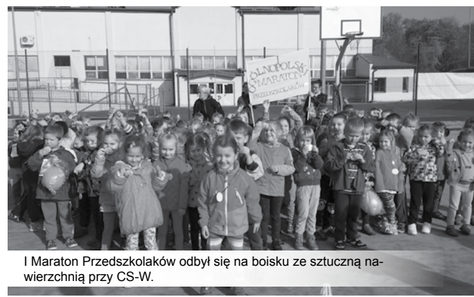
I Maraton Przedszkolaków odbył się na boisku ze sztuczną nawierzchnią przy CS-W.

Kolejne miesiące zapowiadają się dla najmłodszych równie ciekawie i atrakcyjnie – przedszkolaki będą miały wiele okazji, by rozwijać swoje umiejętności, odkrywać zainteresowania i poszerzać wiedzę o otaczającym nas świecie. (PP)