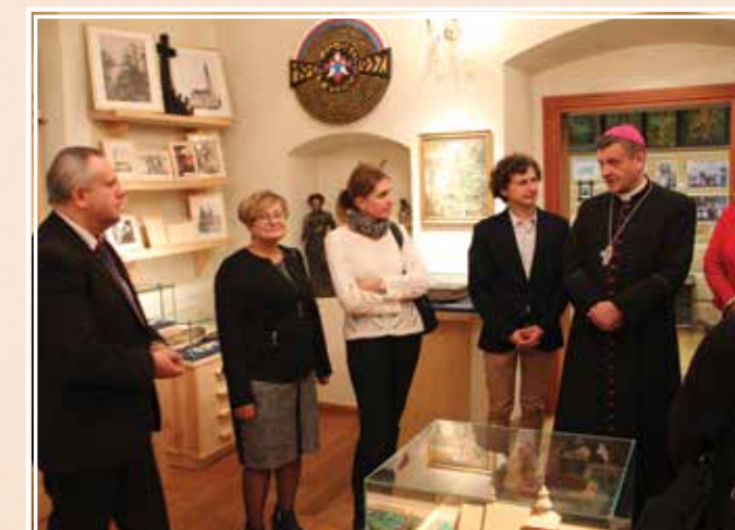
Wizyta w Izbie Historycznej Kóz była kolejną okazją do przywołania wspomnień.