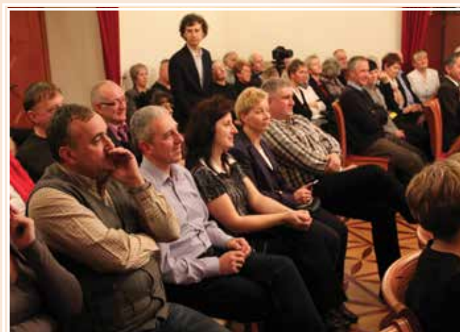
Mieszkańcy licznie i z entuzjazmem powitali biskupa w Pałacu Czeczów.