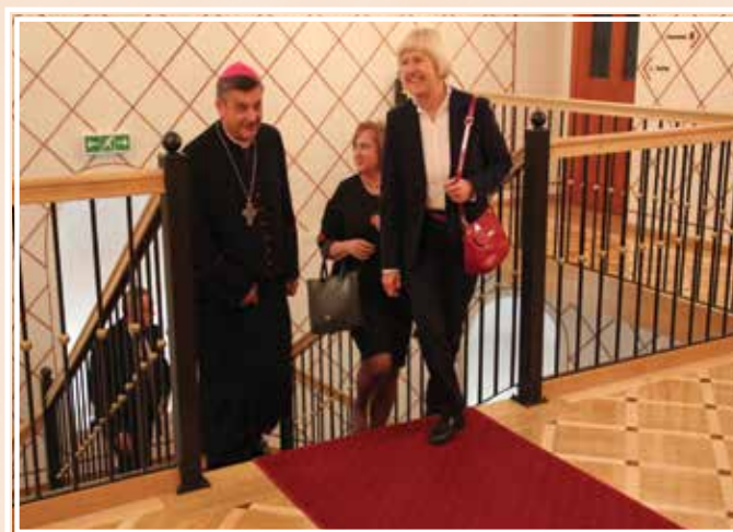
Nieodłączną częścią wizyty było zwiedzanie odrestaurowanego pałacu.