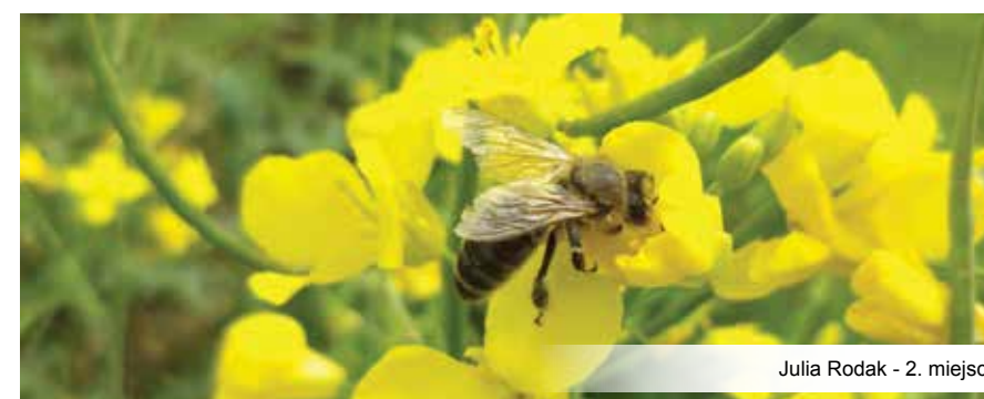
Julia Rodak - 2. miejsce

Po raz kolejny już odbył się w naszej miejscowości konkurs „Kadry z wakacyjnych podróży”. Coroczne zmagania miłośników fotografii, to okazja do zaprezentowania ciekawych epizodów związanych z wakacyjnymi wojażami, jak również możliwość podzielenia się pozytywnymi wspomnieniami z szerszą publicznością. W tegorocznej edycji wzięło udział 33 uczestników, którzy przedstawili 93 zdjęcia.