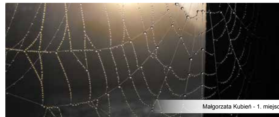
Małgorzata Kubień - 1. miejsce