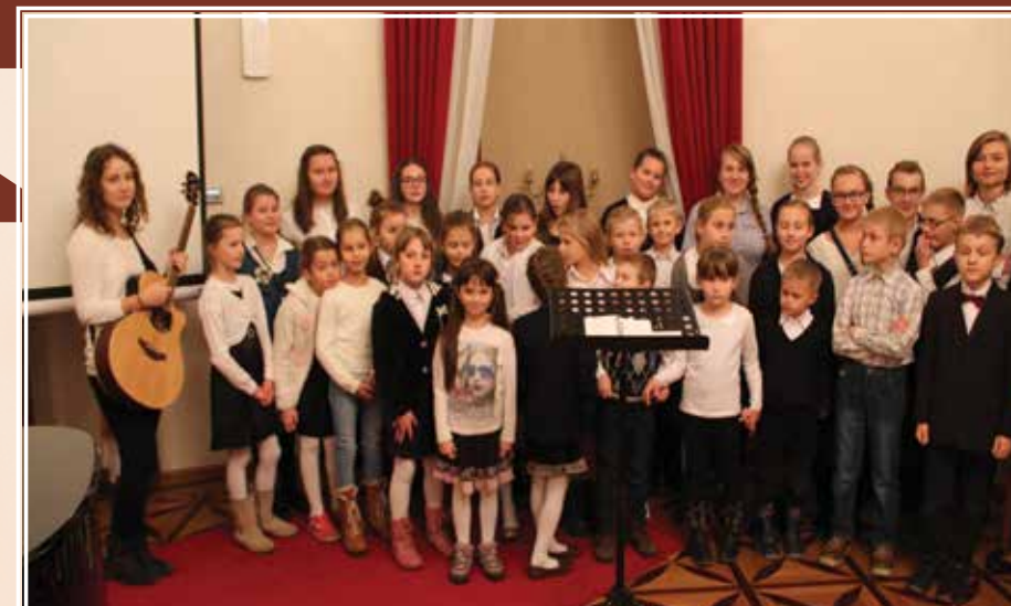
Wspomnieniowy wieczór występem uświetniła schola.