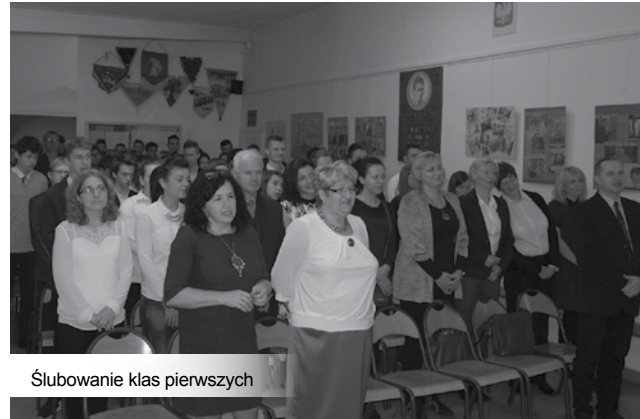
Ślubowanie klas pierwszych

Co wydarzyło się w szkole w październiku? - Spokojnie i rytmicznie realizowaliśmy projekty rozwijające zainteresowania uczniów. Był wyjazd na lekcje do Planetarium w Chorzowie. Uczniowie wzięli udział na ATH w Bielsku-Białej w wykładzie popularyzatora kosmologii dra St. Bajtlika „O nieskończoności”. Obejrzelni w Kinie Helios „Pileckiego”, a wcześniej „Karbałę”. Najliczniejsza od lat grupa członków Klubu Europejskiego „Brukselka” spędziła noc filmową na naszym licealnym „strychu” wysłuchawszy wcześniej wykładu filmoznawcy Marka Małeckiego. Również w październiku były eliminacje olimpiad o zdrowiu psychicznym człowieka, z wiedzy o społeczeństwie, z eko-