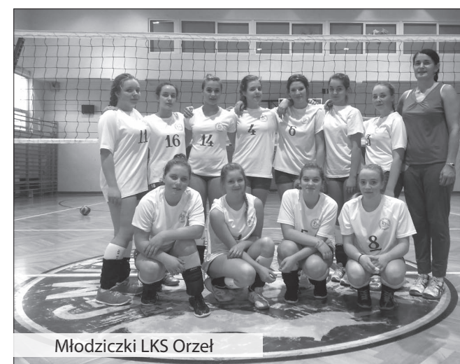
Młodziczki LKS Orzeł