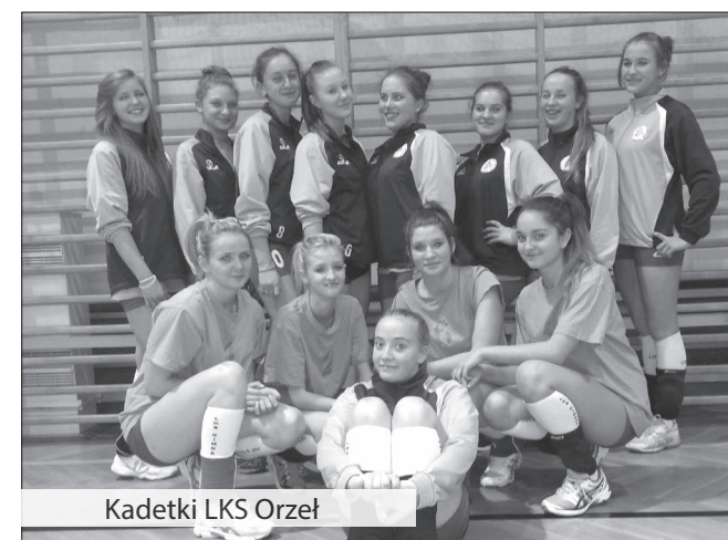
Kadetki LKS Orzeł