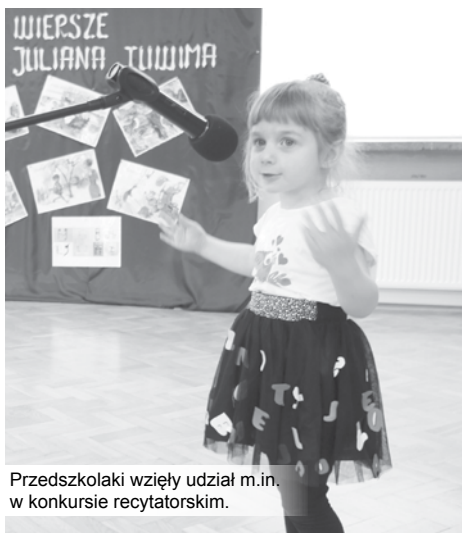
Przedszkolaki wzięły udział m.in. w konkursie recytatorskim.

Koziańskie przedszkolaki po raz drugi już zwyciężyły w ogólnopolskim konkursie „Mamo tato wolę wodę”, wygrywając tym samym atrakcyjne nagrody, z których korzystać będą mogły w przedszkolu. Sukces