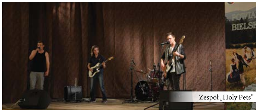
Zespół „Holy Pets”