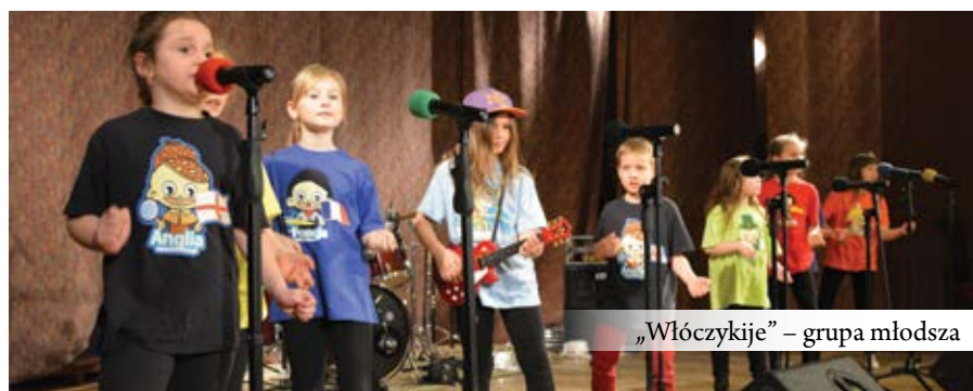
„Włóczykije” – grupa młodzieżowa