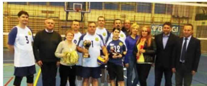
Drużyna z Kóz wygrała VI Powiatowy Turniej Piłki Siatkowej Radnych i Pracowników Samorządowych.