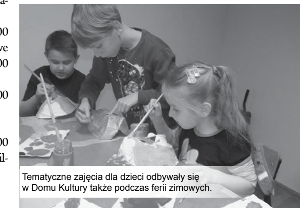
Tematyczne zajęcia dla dzieci odbywały się w Domu Kultury także podczas ferii zimowych.