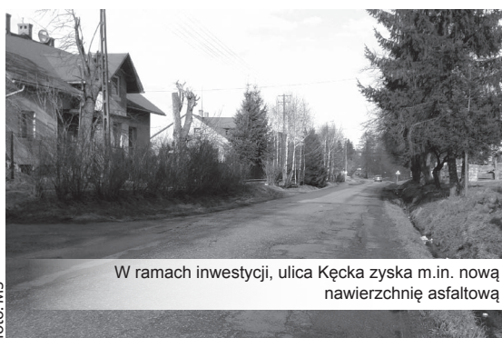
W ramach inwestycji, ulica Kęcka zyska m.in. nową nawierzchnię asfaltową