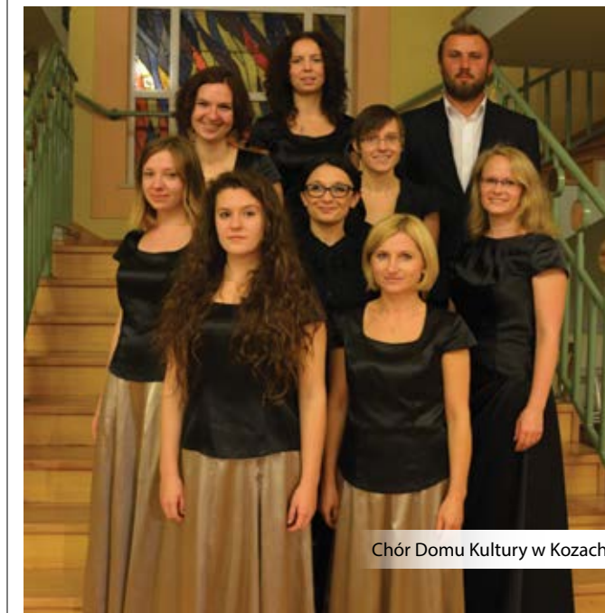
Chór Domu Kultury w Kozach