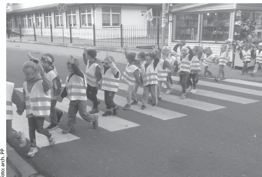
Sprzyjająca pogoda to okazja dla najmłodszych do wspólnych spacerów na otwartym powietrzu.