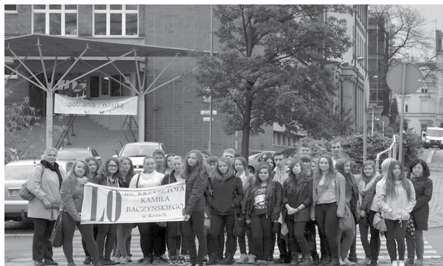
Uczniowie koziańskiego liceum wysłuchali m.in. wykładu na Wydziale Biologii i Ochrony Środowiska Uniwersytetu Śląskiego w Katowicach.