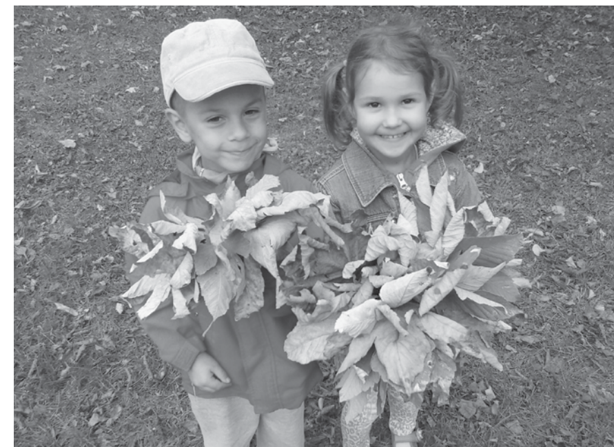
Pierwszy miesiąc nowego roku szkolnego, to m.in. poszukiwanie oznak jesieni.

E. Szwarz/A. Polak/S.Dymowska/J. Kućka/R