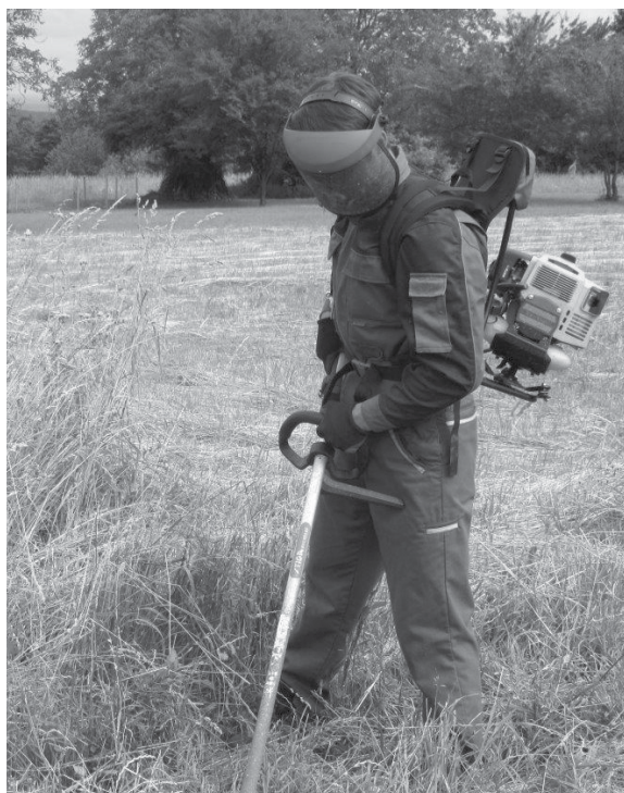
Spółdzielnia oferuje m.in. wykaszanie nieużytków.