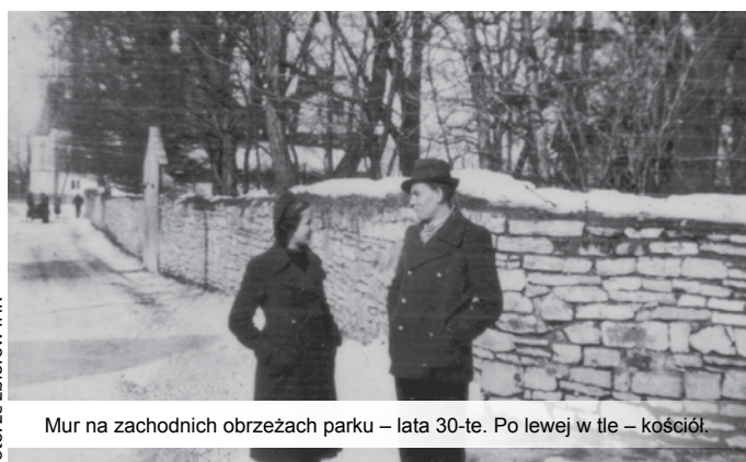
Mur na zachodnich obrzeżach parku – lata 30-te. Po lewej w tle – kościół.

nego remontu, odtworzono i przywrócono pierwotny układ ścieżek. Wykorzystano do tego plan katastralny koziańskiego dworu z 1847 r. – przechowywany w Ośrodku Dokumentacji Zabytków w Warszawie.