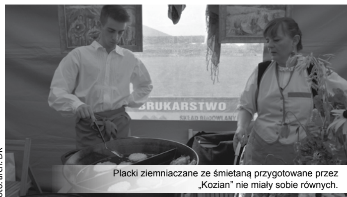
Placki ziemniaczane ze śmietaną przygotowane przez „Kozian” nie miały sobie równych.