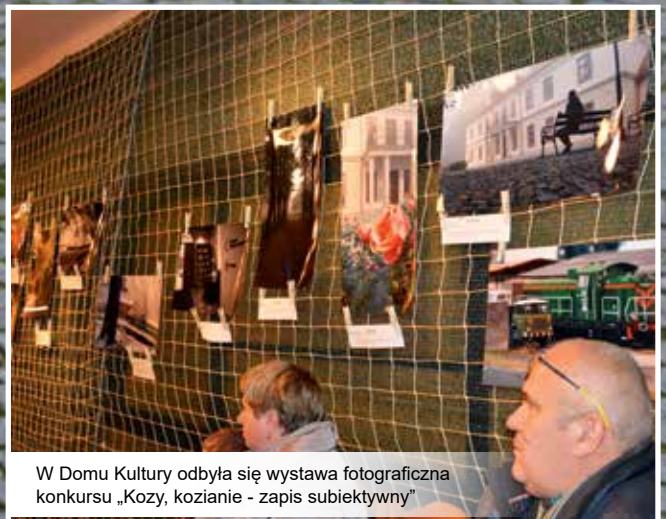
W Domu Kultury odbyła się wystawa fotograficzna konkursu „Kozy, kozianie - zapis subiektywny”