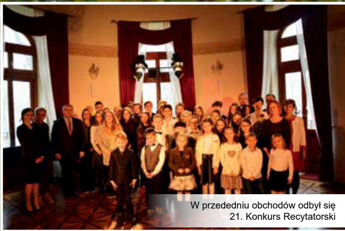
W przededniu obchodów odbył się 21. Konkurs Recytatorski