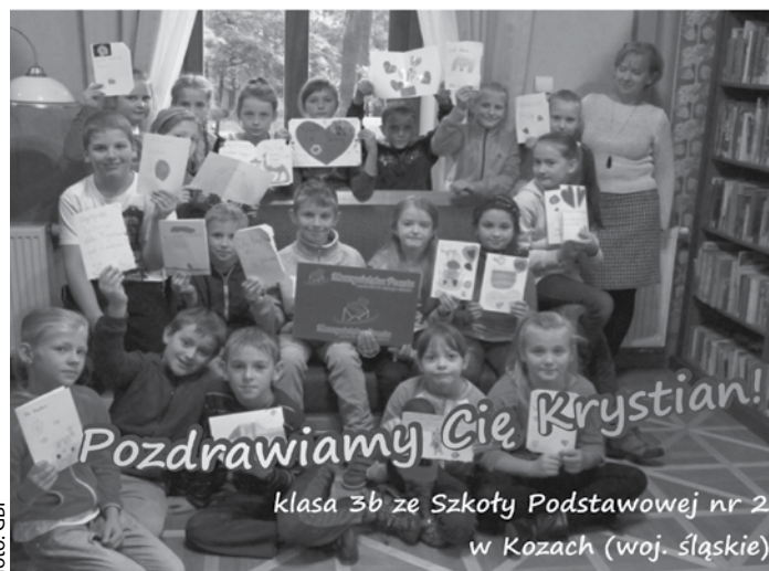
klasa 3b ze Szkoły Podstawowej nr 2 w Kozach (woj. śląskie)