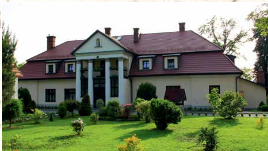
Dwór w Hałcnowie – obecnie dom zakonny sióstr serafitek (fot. z 2014 r.)