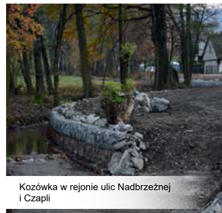
Kozówka w rejonie ulic Nadbrzeżnej i Czapl