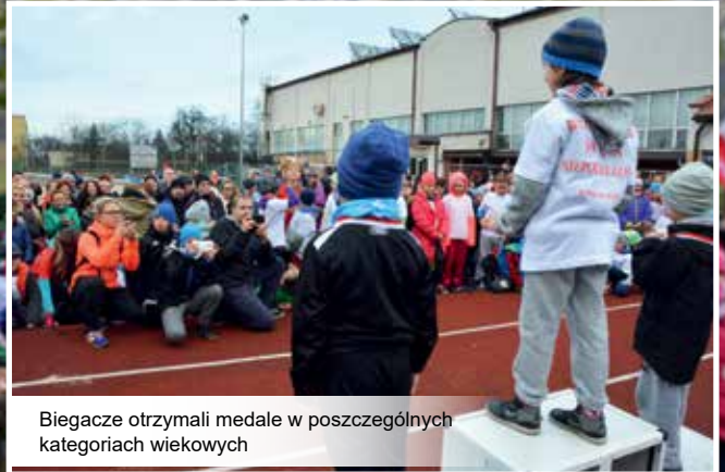
Biegacze otrzymali medale w poszczególnych kategoriach wiekowych