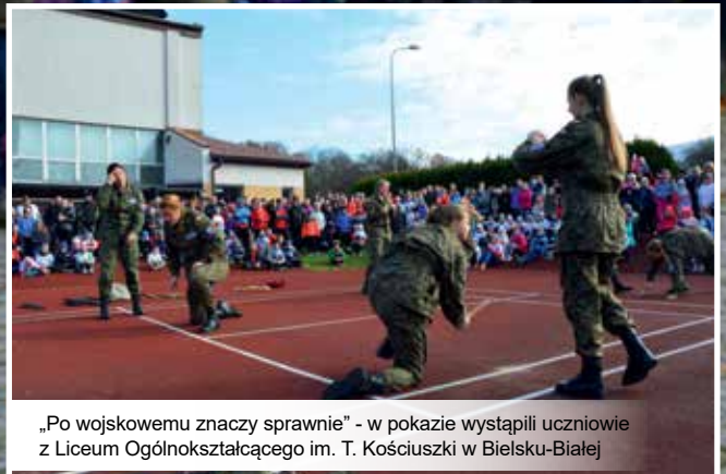
„Po wojskowemu znaczy sprawnie” - w pokazie wystąpili uczniowie z Liceum Ogólnokształcącego im. T. Kościuszki w Bielsku-Białej