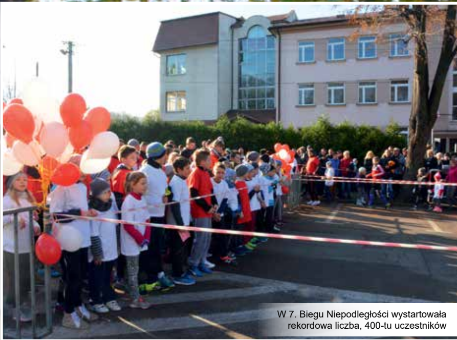
W 7. Biegu Niepodległości wystartowała rekordowa liczba, 400-tu uczestników