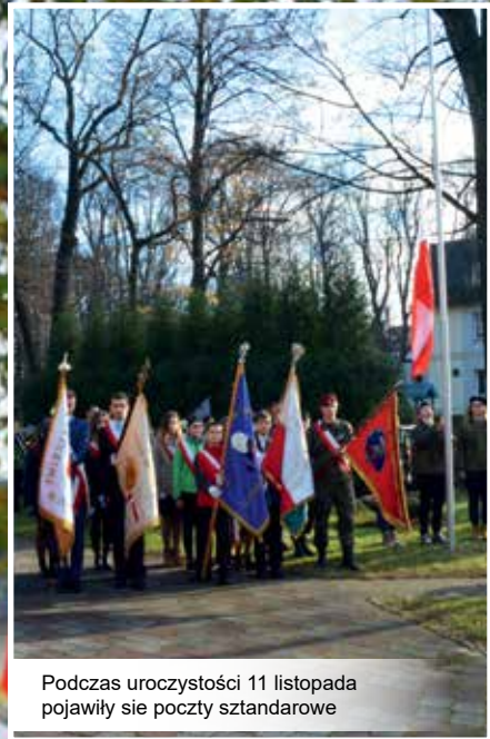
Podczas uroczystości 11 listopada pojawiły się poczty sztandarowe