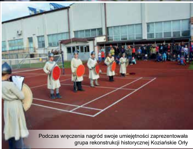
Podczas wręczenia nagród swoje umiejętności zaprezentowała grupa rekonstrukcji historycznej Koziańskie Orły