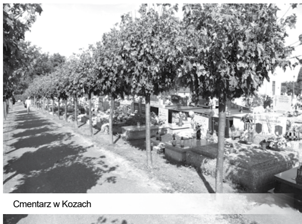
Cmentarz w Kozach

mi”, czyli dziećmi, sam termin wskazuje więc na nierozzerwalną więź pokoleń. Dziadami nazywano kiedyś też wędrownych żebraków, którzy od zarania dziejów uważani byli za łącznik pomiędzy światem żywych, a martwych. Warto pamiętać, że Dziady obchodzono zarówno jesienią, jak i wiosną, tuż po Wielkanocy, kiedy to stanowiły część święta zwanego Radonicą, co zaś wskazuje zarówno na „ród”, jak i na „radość”. Dobrze więc, przy okazji święta przodków, po pierwsze czerpać radość z tego, że