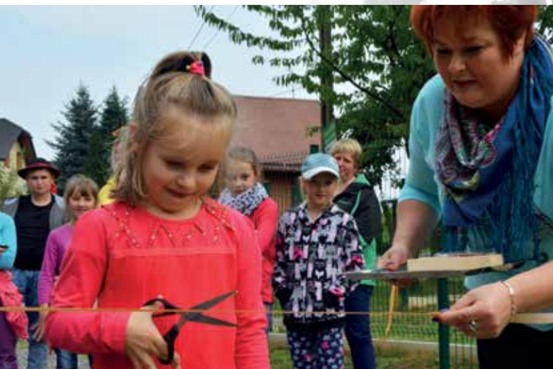
Tegoroczny festiwal po raz pierwszy odbył się przy ulicy Podgórskiej. Nim pod kociółkami pojawiły się płomienie, wspólnie z najmłodszymi dokonano uroczystego otwarcia doposażonego placu zabaw