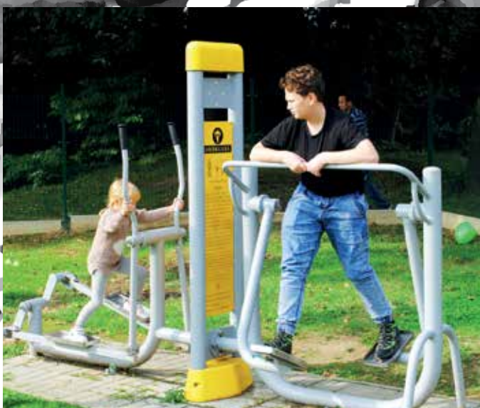
Plac zabaw przy ulicy Podgórskiej wyposażony jest m.in. w sprzęt do ćwiczeń siłowych