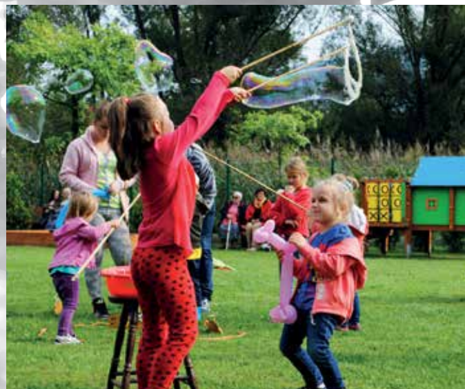
Na placu zabaw nie zabrakło dodatkowych atrakcji dla dzieci, m.in. ogromnych baniek mydlanych