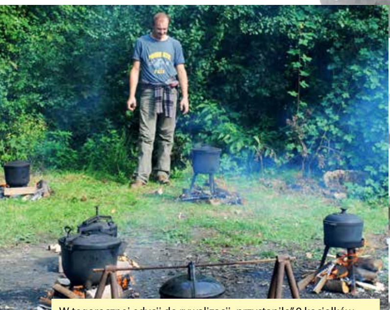
W tegorocznej edycji do rywalizacji „przystąpiło” 9 kociółków