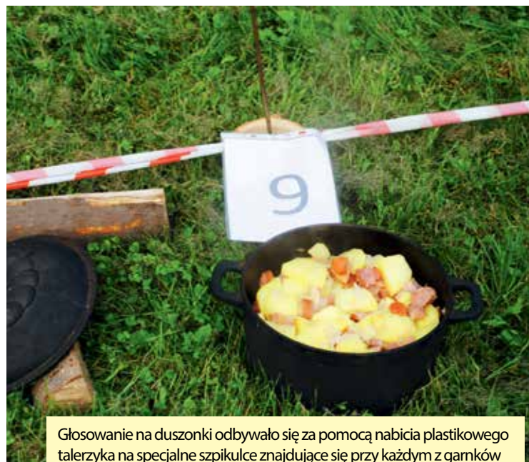
Głosowanie na duszonki odbywało się za pomocą nabicia plastikowego talerzyka na specjalne szpikulce znajdujące się przy każdym z garnków