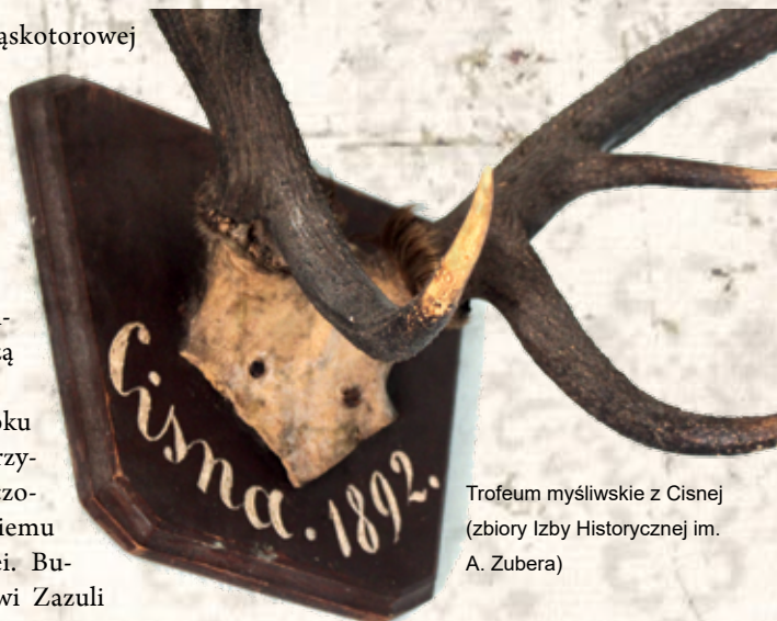
Trofeum myśliwskie z Cisnej (zbiory Izby Historycznej im. A. Zubera)