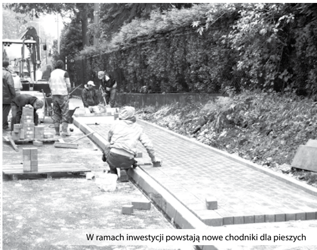
W ramach inwestycji powstają nowe chodniki dla pieszych