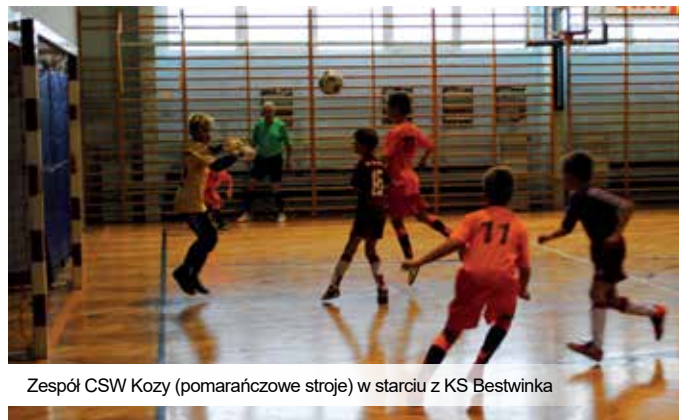
Zespół CSW Kozy (pomarańczowe stroje) w starciu z KS Bestwinka