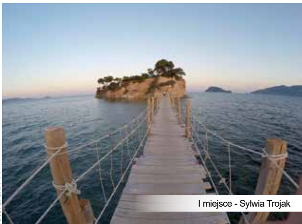
I miejsce - Sylwia Trojak