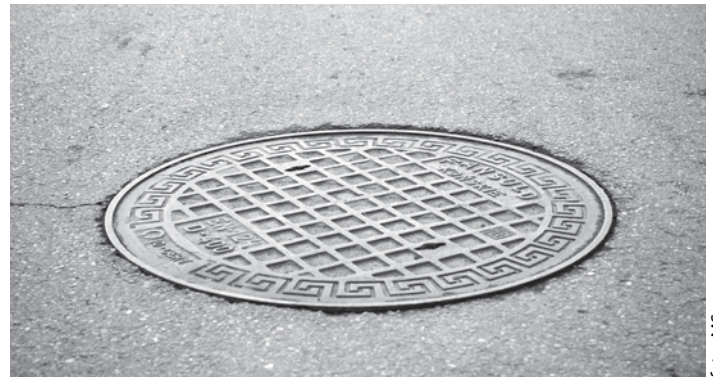
Przebudowa ulicy Beskidzkiej ujawniła liczne przypadki nieprawidłowego korzystania z kanalizacji sanitarnej, powodujące blokowanie kanału