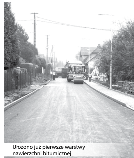
Ułożono już pierwsze warstwy nawierzchni bitumicznej