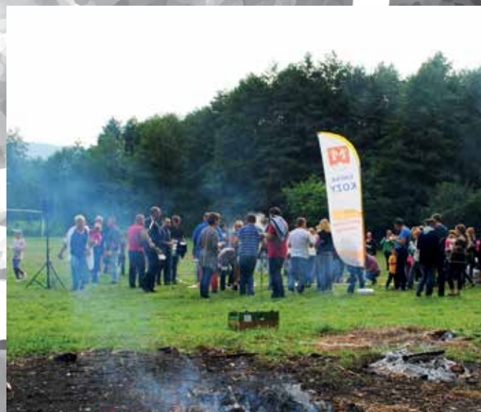
Każdy z uczestników otrzymał od organizatorów upominki kuchenne