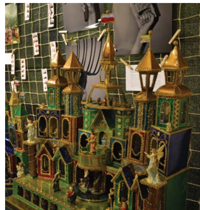
Szopka Roku 2015