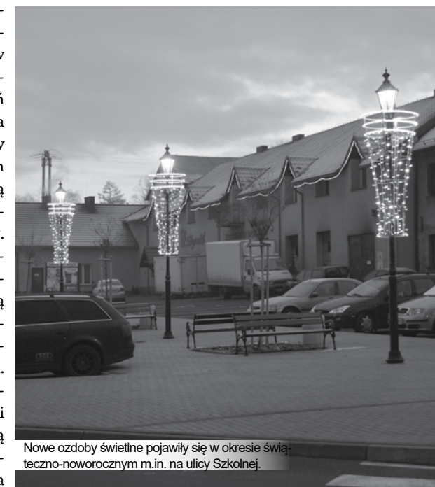
Nowe ozdoby świetlne pojawiły się w okresie świąteczno-noworocznym m.in. na ulicy Szkolnej.