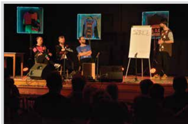
Łowcy.B polubili Dom Kultury w Kozach, to już trzecia wizyta. Występy zaproszonych artystów uzupełniają bogatą ofertę artystyczną proponowaną przez koziańskich twórców.

W ferie w Domu Kultury nie można się nudzić – warsztaty twórcze, zabawy, wycieczki – każdy znajdzie coś dla siebie.