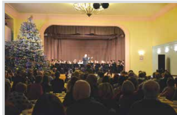
Tłumy na Koncercie Noworocznym Młodzieżowej Orkiestry Dętej. Wypełniona sala widowiskowa Domu Kultury to bardzo częsty widok w mijającym roku – prawie setka różnorodnych imprez.

W ferie w Domu Kultury nie można się nudzić – warsztaty twórcze, zabawy, wycieczki – każdy znajdzie coś dla siebie.