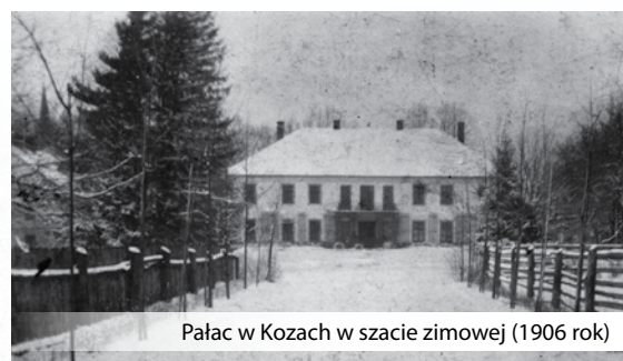
Pałac w Kozach w szacie zimowej (1906 rok)