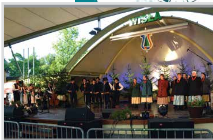
Zespół Pieśni i Tańca KOZIANIE na TKB w Wiśle. Bogactwo naszej tradycji i kultury prezentowane jest często poza Kozami. Tydzień Kultury Beskidzkiej gościł naszych KOZIAN, a udział naszej Orkiestry w Ogólnopolskim Festiwalu Młodzieżowych Orkiestr Dętych w Inowrocławiu był kolejnym sukcesem (potwierdzonym licznymi nagrodami).