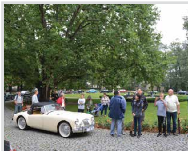
Rajd starych samochodów. Nie tylko artyści, ale także pasjonaci, hobbysci, osoby „pozytywnie zakręcone” to prawdziwa siła napędowa życia społecznego.