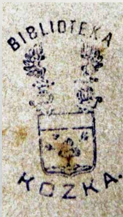
Pieczęć-exlibris „Biblioteki Kózkiej”.

Tekst powstał na podstawie: Fototeki Adolfa Zubera (zbiory Izby Historycznej); książki: Jan Jakubiec „Na drodze stromej i śliskiej. Autobiografia socjologiczna”, Kraków 2005.