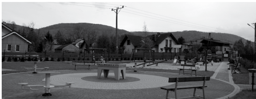
Obok placu zabaw przy ulicy Agrestowej powstanie boisko sportowe o wymiarach ok. 25 m x 40 m.

Gmina Kozy podpisała umowę w Urzędzie Marszałkowskim Województwa Śląskiego na dofinansowanie budowy boiska rekreacyjnego przy ulicy Agrestowej w Kozach. Wsparcie finansowe udzielone będzie w ramach Programu Rozwoju Obszarów Wiejskich na lata 2014-2020. Obecnie trwają przygotowania do zorganizowania konkursu ofert na realizację zadania. W ramach inwestycji powstanie boisko piłkarskie o nawierzchni trawiastej o wymiarach około 25 m x 40 m. Będzie ono ogrodzone piłkochwytem ze wszystkich stron. Przy boisku ustawione zostaną ławki dla obserwatorów rozgrywek piłkarskich. Budowa boiska jest kontynuacją zagospodarowania terenu przy ulicy Agrestowej. Wcześniej powstał tutaj plac zabaw „Kolorowe Zacisze”, który cieszy się ogromną popularnością wśród mieszkańców naszej gminy oraz osób przyjezdnych. (UG)