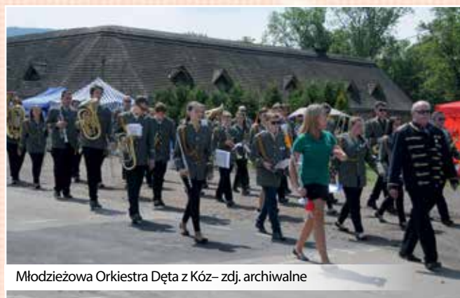
Młodzieżowa Orkiestra Dęta z Kóz – zdj. archiwalne