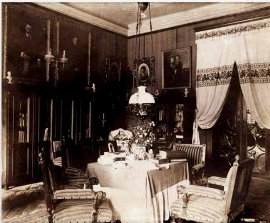
Wnętrze biblioteki w Pałacu Czczów (pocz. XX wieku).