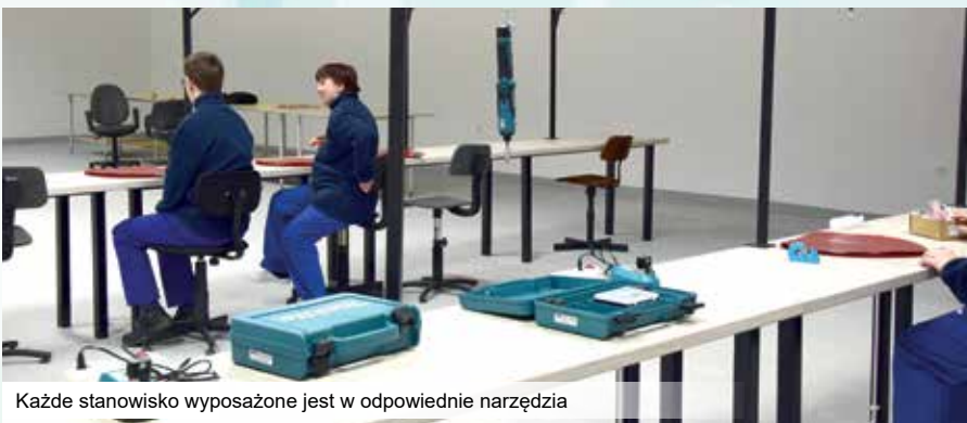
Każde stanowisko wyposażone jest w odpowiednie narzędzia