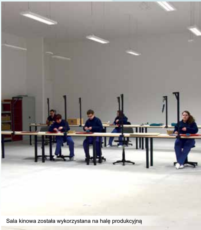
Sala kinowa została wykorzystana na halę produkcyjną