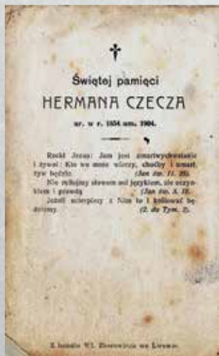
Pamiętkowy obrazek żałobny z modlitwą za zmarłego (z lewej strony)

W tekście wykorzystano informacje zawarte w czasopiśmie: „Gazeta Warszawska”, „Kurjer Warszawski”, „Wieniec-Pszczółka”, „Tygodnik Rolniczy”, „Słowo Polskie”, „Gwiazdka Cieszyńska”, „Czas”, „Neue Freie Presse”.