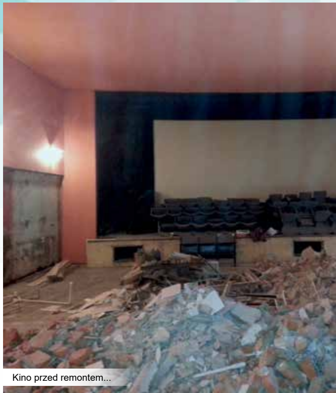
Kino przed remontem...