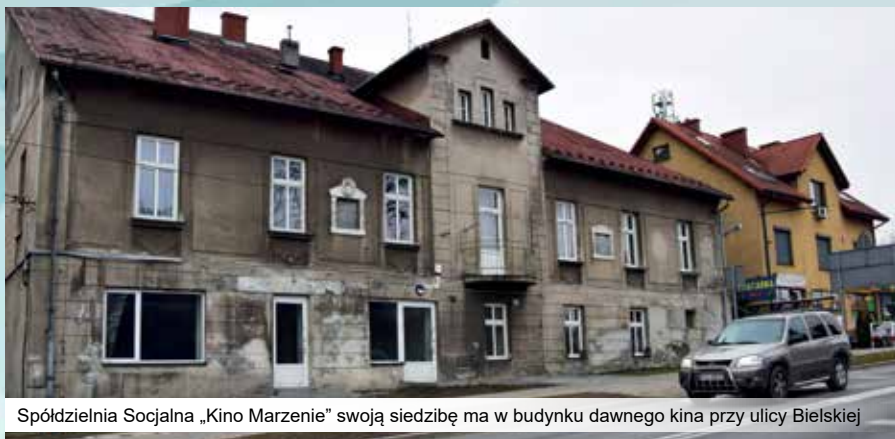
Spółdzielnia Socjalna „Kino Marzenie” swoją siedzibę ma w budynku dawnego kina przy ulicy Bielskiej