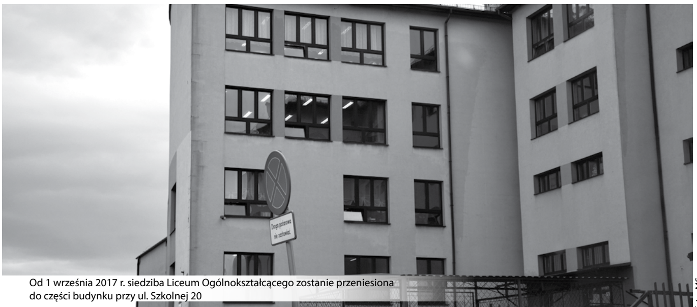
Od 1 września 2017 r. siedziba Liceum Ogólnokształcącego zostanie przeniesiona do części budynku przy ul. Szkolnej 20

Dzięki przeniesieniu Liceum do nowej sie-