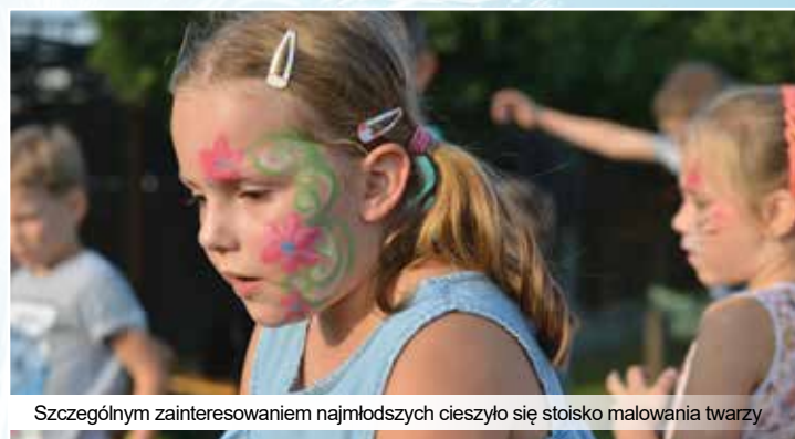
Szczególnym zainteresowaniem najmłodszych cieszyło się stoisko malowania twarzy