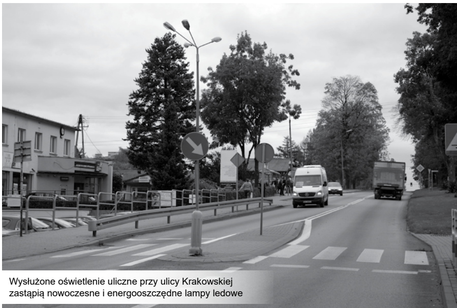
Wysłużone oświetlenie uliczne przy ulicy Krakowskiej zastąpią nowoczesne i energooszczędne lampy ledowe

Przypomnę, że końcem lutego bieżącego roku złożyliśmy wniosek o dofinansowanie planowanej inwestycji ze środków Unii Europejskiej na lata 2014-2020 w konkursie ogłoszonym przez Narodowy Fundusz Ochrony Środowiska i Gospodarki Wodnej w Warszawie. Inwestycja obejmuje budowę kanalizacji sanitarnej w dwóch obszarach gminy leżących w Aglomeracji Pisarzowice i posiadających minimalny wymagany wskaźnik koncentracji, tj. 90 mieszkańców na 1 km sieci. Nasz wniosek został zweryfikowany