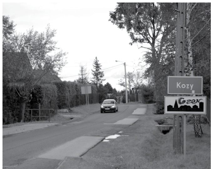
Po planowanej przebudowie odcinka ulicy Witosy bezpieczeństwo użytkowników drogi w tym rejonie ulegnie znaczącej poprawie