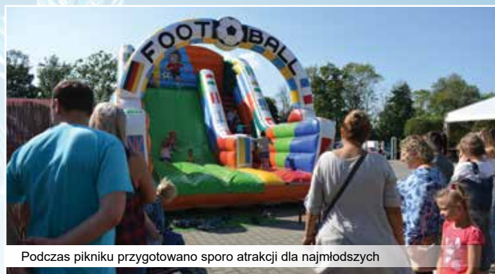
Podczas pikniku przygotowano sporo atrakcji dla najmłodszych

Świetna atmosfera przekłada się na zaangażowanie w pracy, ta na przestrzeni lat została doceniona przez kapituły nagradzające przedsiębiorców. W firmowej kolekcji znajdują się m.in. prestiżowy Dedal – nagroda gospodarcza subregionu południowego 2010, Godło Złoty Kask 2012, Złoty Filar Budownictwa 2011, Przedsiębiorca Roku 2008, Gazele Biznesu 2008.