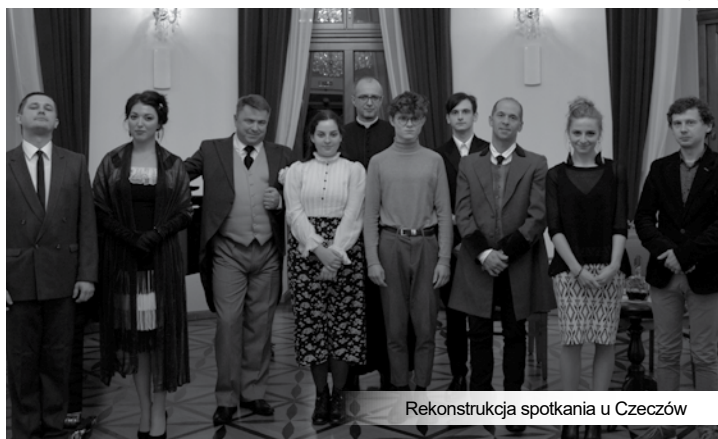
Rekonstrukcja spotkania u Czeczów