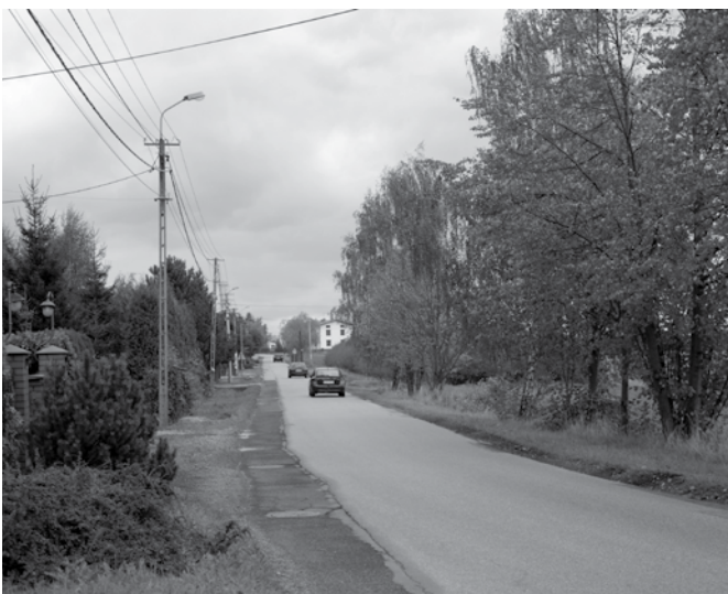
W ramach wspólnej inwestycji Gminy Kozy ze Starostwem Powiatowym przebudowany zostanie blisko 2-kilometrowy odcinek ulicy Przeczniej