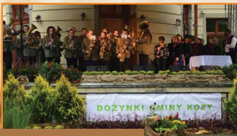
Korowód dożynkowy witała w parku dworskim Młodzieżowa Orkiestra Dęta