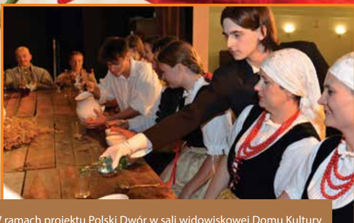
W ramach projektu Polski Dwór w sali widowiskowej Domu Kultury odbyła się rekonstrukcja pt. „Dożynki u Czeczów w XX wieku”