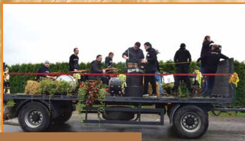
Uczestnicy projektu Walimy w Kocioł w korowodzie dożynkowym