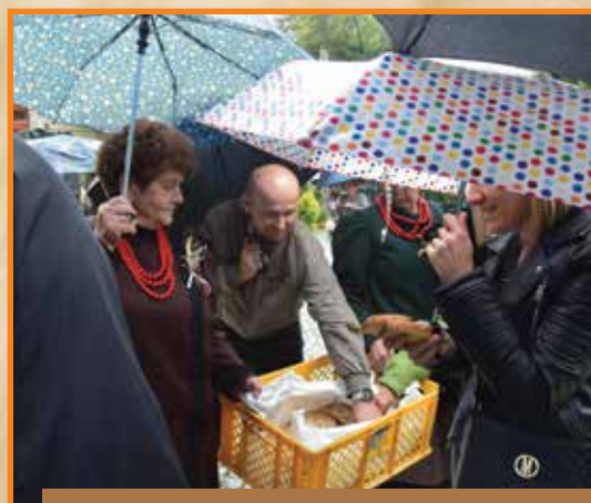
Panie z Koła Gospodyń Wiejskich częstowały wszystkich gości chlebem ze smalcem i ogórkami kiszonymi