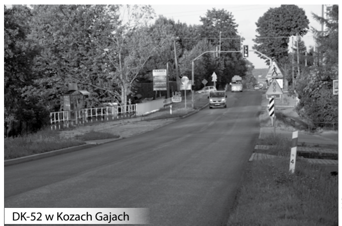
DK-52 w Kozach Gajach