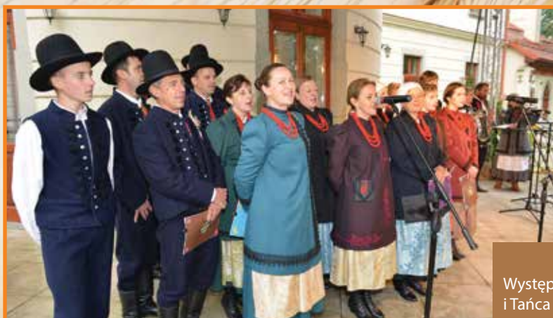
Występ Zespołu Pieśni i Tańca KOZIANIE