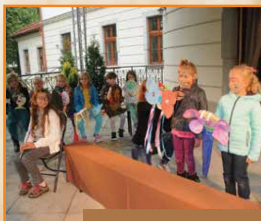
Na scenie swoje umiejętności zaprezentowali także najmłodszy