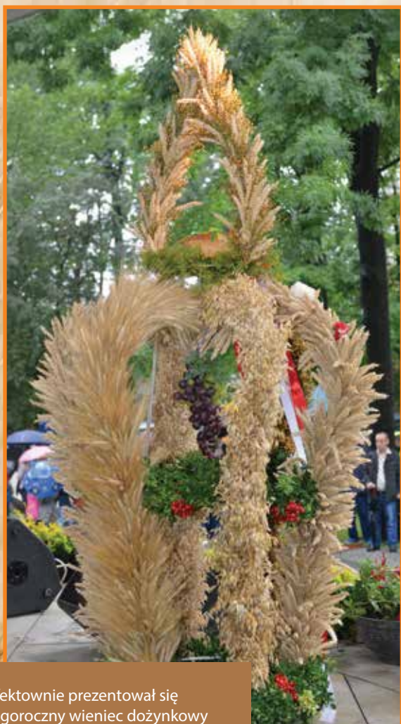
Efektownie prezentował się tegoroczny wieniec dożynkowy