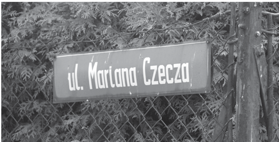
ulica Mariana Czezcza w Hałcnowie