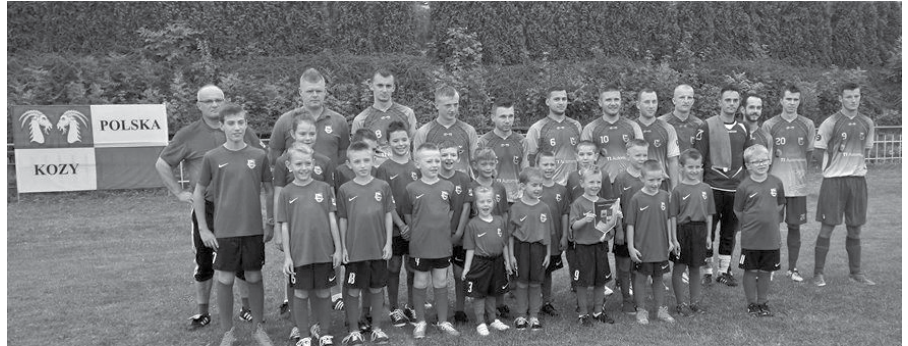
Seniorski zespół Orła Kozy po 3. kolejnych usadowił się w ścisłej czołówce b-klasowych rozgrywek