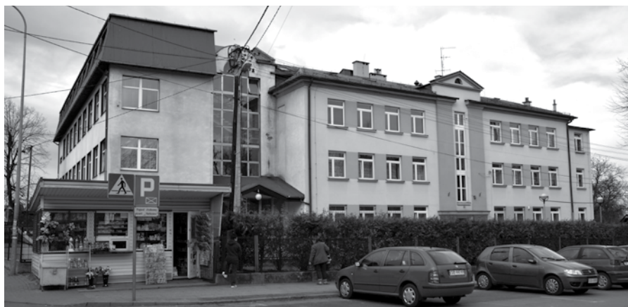
Termomodernizacja Szkoły Podstawowej nr 1 rozpoczęła się początkiem kwietnia