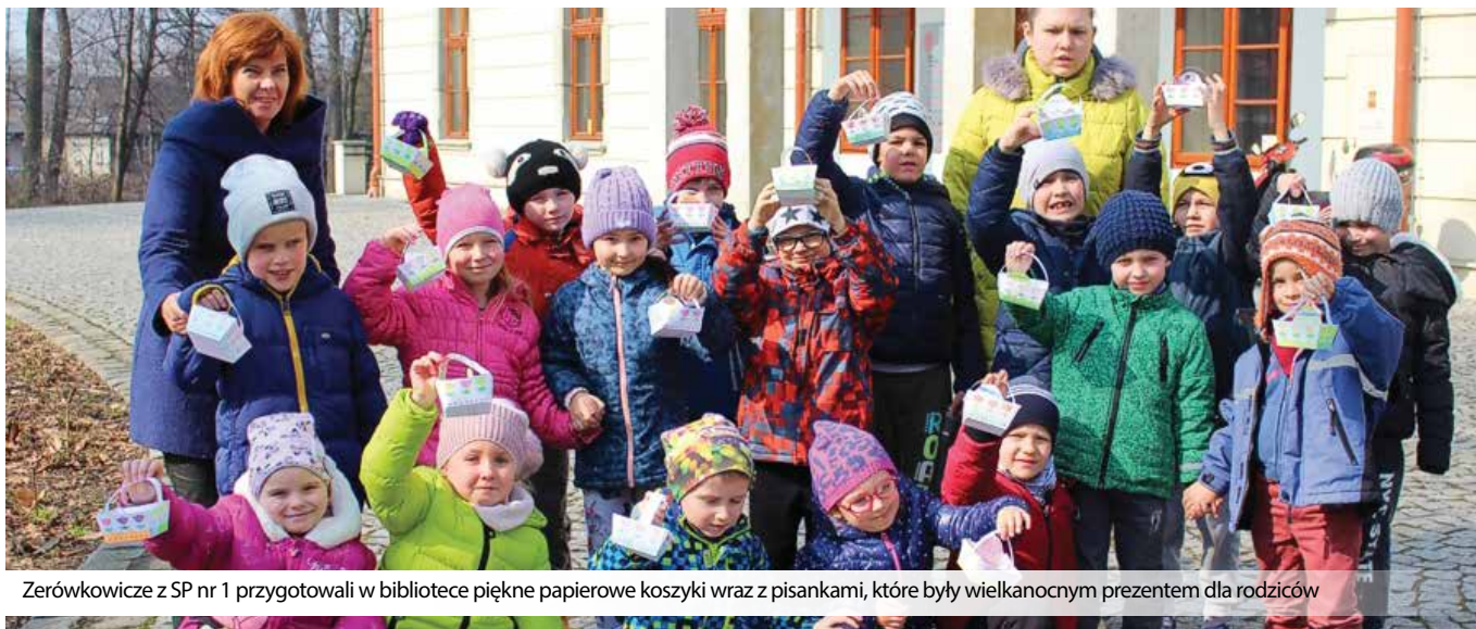
Zerówkowicze z SP nr 1 przygotowali w bibliotece piękne papierowe koszyki wraz z pisankami, które były wielkanocnym prezentem dla rodziców