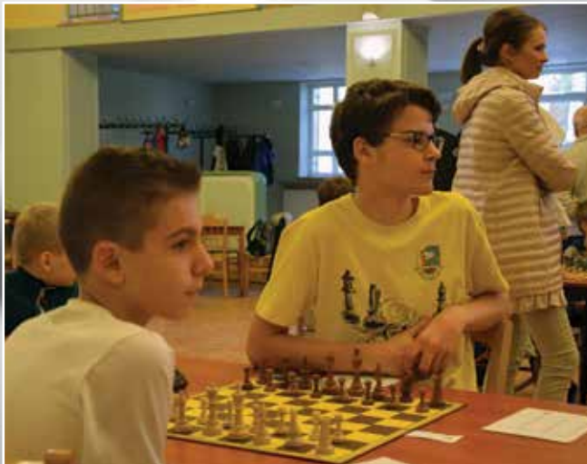
Wśród uczestników pojawili się zawodnicy niezrzeszeni, ale także reprezentujący kluby sportowe. Nie zabrakło zawodników reaktywowanej sekcji szachowej w LKS Orzeł Kozy