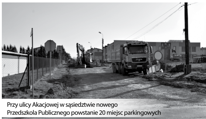
Przy ulicy Akacjowej w sąsiedztwie nowego Przedszkola Publicznego powstanie 20 miejsc parkingowych