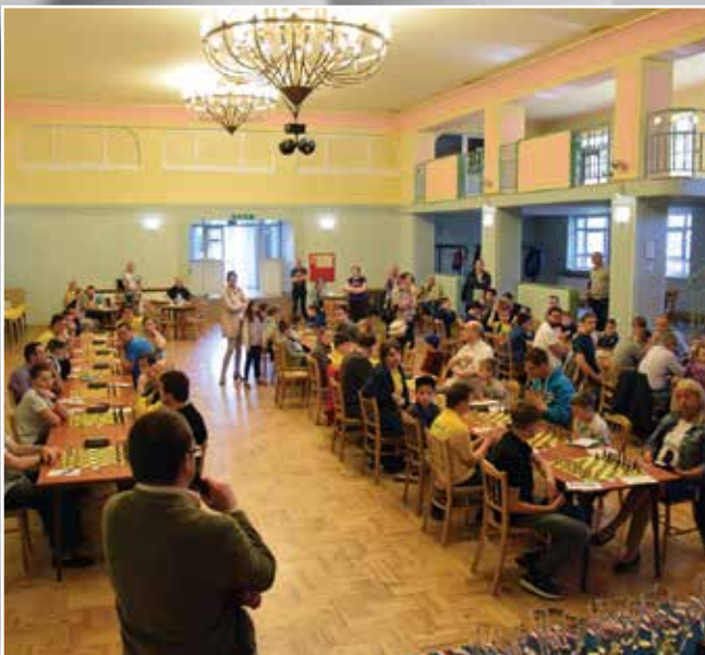
Turniej rozegrany został w ramach cyklu „100 turniejów na 100-lecie Odzyskania Niepodległości” pod auspicjami Polskiego Związku Szachowego. Turniej cieszył się popularnością, chciało w nim wziąć udział ponad 200. klubów sportowych