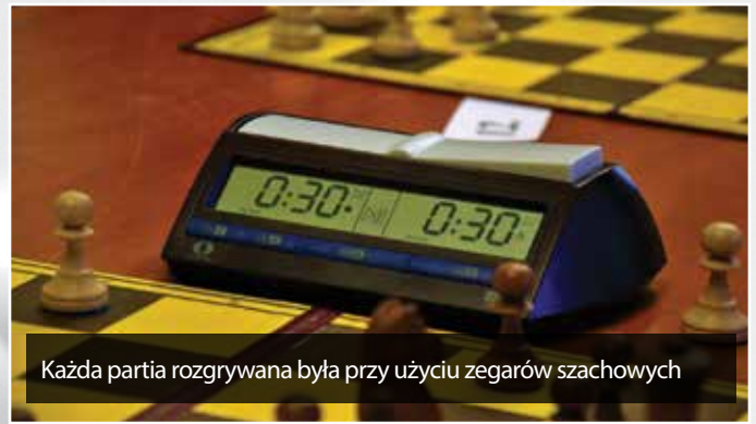
Każda partia rozgrywana była przy użyciu zegarów szachowych