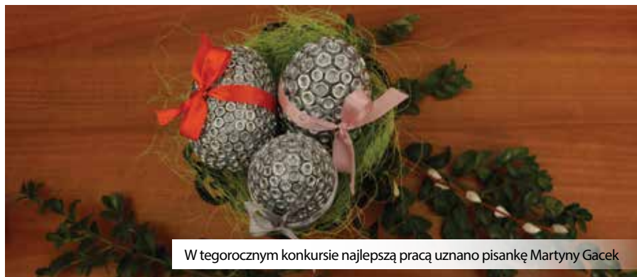
W tegorocznym konkursie najlepszą pracą uznano pisanek Martyny Gacek