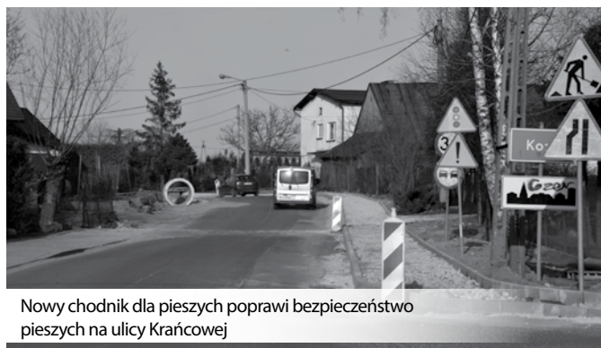
Nowy chodnik dla pieszych poprawi bezpieczeństwo pieszych na ulicy Krańcowej