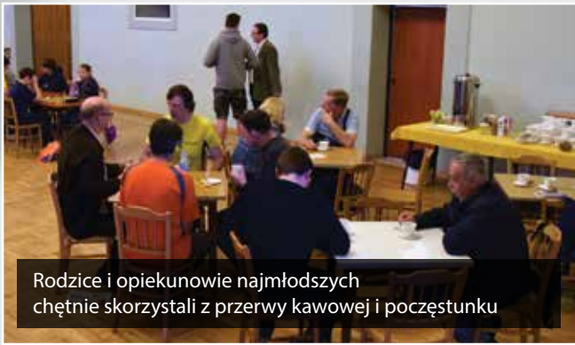
Rodzice i opiekunowie najmłodszych chętnie skorzystali z przerwy kawowej i poczęstunku