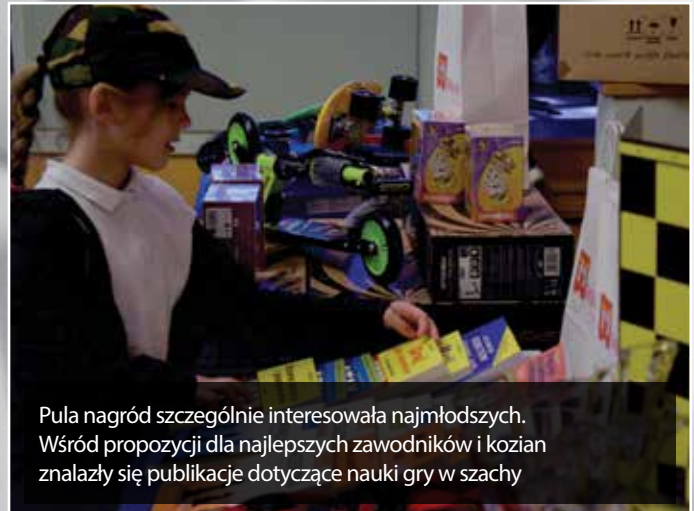
Pula nagród szczególnie interesowała najmłodszych. Wśród propozycji dla najlepszych zawodników i kozian znalazły się publikacje dotyczące nauki gry w szachy