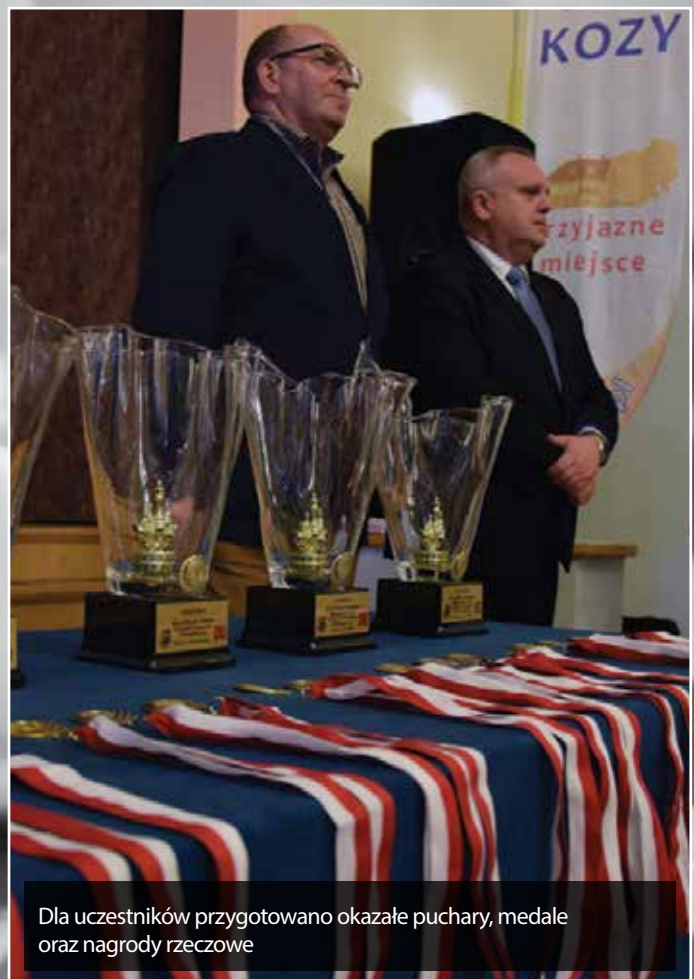
Dla uczestników przygotowano okazałe puchary, medale oraz nagrody rzeczowe