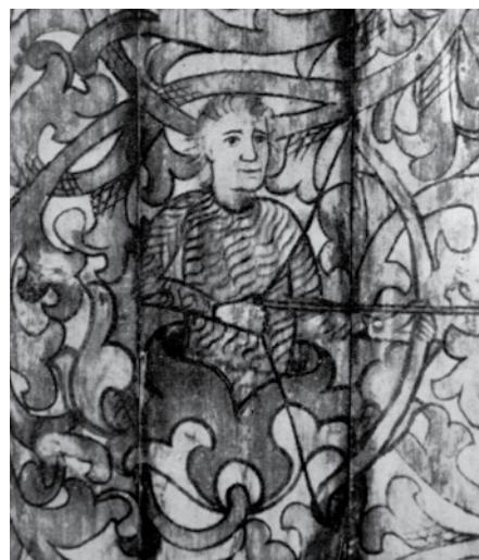
„Dziki mąż” - fragment malowideł stropowych z drewnianego kościoła w Kozach