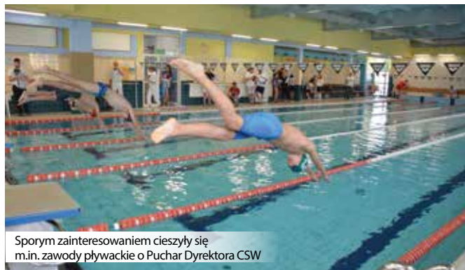
Sporym zainteresowaniem cieszyły się m.in. zawody pływackie o Puchar Dyrektora CSW

Zainteresowanie mieszkańców ofertą CSW dobrze rokuje na przyszłość. (CSW)