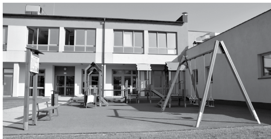
Jedną z największych inwestycji w historii Gminy Kozy była budowa nowego Przedszkola Integrycyjnego.

Doposażamy place zabaw, nowe urządzenia zyskały place przy: Lipowej, Wrzosowej, Tęczowej. Wybudowaliśmy też boisko do piłki nożnej przy ul. Agrestowej. Dotujemy wymianę źródeł ogrzewania w budynkach mieszkalnych i zakupiliśmy kompostowniki, które bezpłatnie udzamy mieszkańcom.