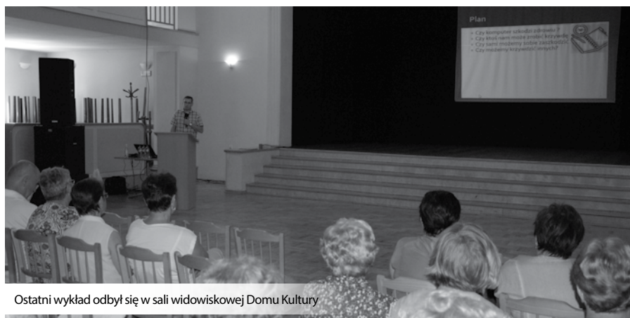
Ostatni wykład odbył się w sali widowiskowej Domu Kultury