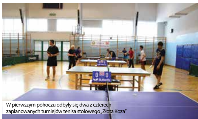
W pierwszym półroczu odbyły się dwa z czterech zaplanowanych turniejów tenisa stołowego „Złota Kozia”