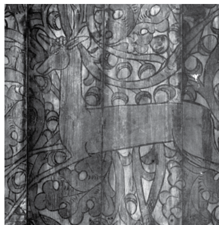
Jeleni - fragment malowideł stropowych z drewnianego kościoła w Kozach (fot. Zbigniew Dłubak)