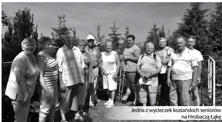
Jedna z wycieczek koziańskich seniorów na Hrobaczej Łące