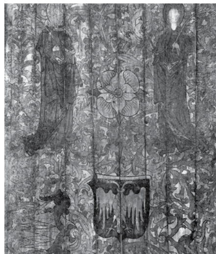
Święte Urszula i Małgorzata – fragment malowideł stropowych z drewnianego kościoła w Kozach

Źródła: „Z dziejów parafii świętych Szymona i Judy w Kozach”, red. T. Borutka, Kraków 1998; Barbara Wolff-Łozińska „Malowidła stropów polskich 1 połowy XVI w. Dekoracje roślinne i kasetonowe”, Warszawa 1971.