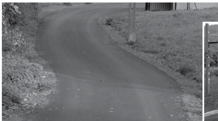
ul. Wrzosowa po remoncie nawierzchni (ok. 330 mb)