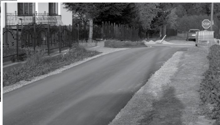
ul. Jaworowa – odcinki drogi, na których wymieniono podbudowę z kruszywa łamanego (ok. 280 mb) i ułożono nowe odcinki nawierzchni bitumicznej (w sumie ok. 450 mb)