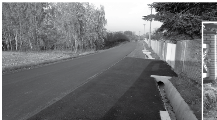
ul. Spółdzielcza – uzyskała nową nawierzchnię na odcinku ok. 370 mb do skrzyżowania z ul. Wyzwolenia (kontynuacja prac rozpoczętych w ubiegłym roku)