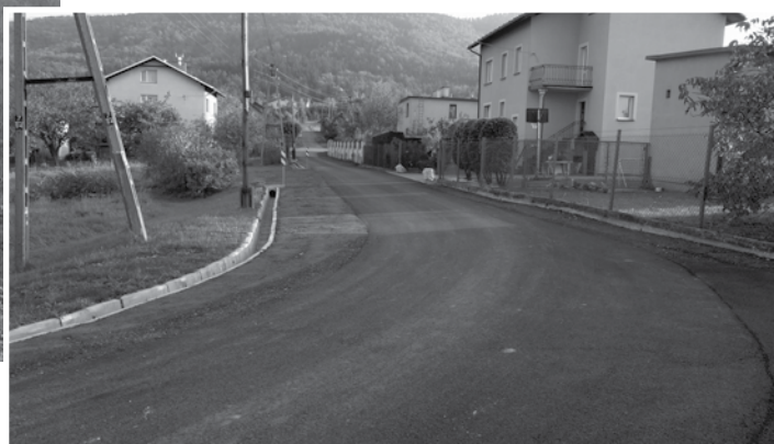
ul. Spokojna – zmodernizowana górna część drogi, ok. 120 mb od zjazdu z ul. Podgórskiej