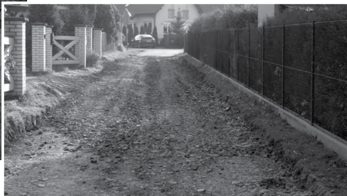
ul. św. Walentego – utwardzenie odcinka o długości ok. 320 mb (roboty w trakcie)