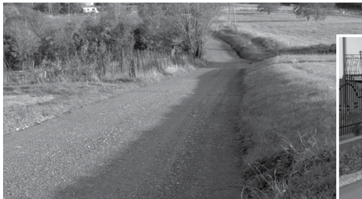
ul. Krzewów – ok. 130 mb ulicy utwardzono kruszywem łamanym i wyrównano frezem asfaltowym. Kontynuację prac zaplanowano na 2019 rok.