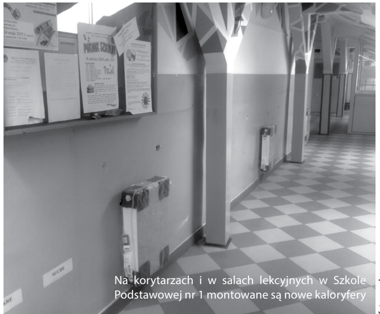
Na korytarzach i w salach lekcyjnych w Szkole Podstawowej nr 1 montowane są nowe kaloryfery