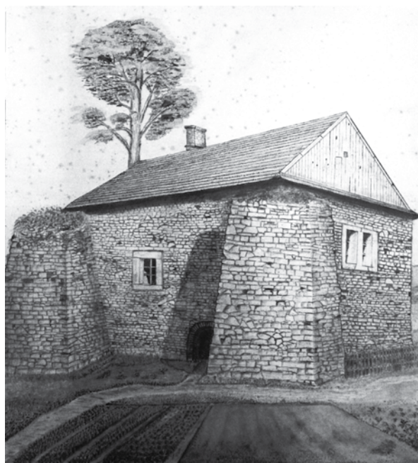
Ruiny średniowiecznych zabudowań w Górnej Wsi (rysunek Adolfa Zubera)