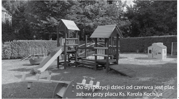
Do dyspozycji dzieci od czerwca jest plac zabaw przy placu Ks. Karola Kochaja

Przypominamy, że na terenie gminy Kozy zlokalizowanych jest jeszcze siedem innych, ogólnodostępnych placów zabaw w rejonach ulic: Lipowej, Tęczowej, Podgórskiej, Zagrodowej, Przecznej, Wrzosowej i Agrestowej. Część z nich wyposażona jest dodatkowo w tzw. siłownie pod chmurką. Przy ulicach Chmielowej, Podgórskiej i Wrzosowej do dyspozycji dzieci są również boiska piłkarskie. (red)