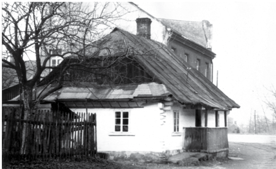
Nieistniejący dom nr 33, przy dzisiejszej ul. Beskidzkiej, to miejsce, gdzie zmarło kilku zarazonych żołnierzy.

parafialne ogólnie określały powód zgonu: „bąble”, „krosty”, „epidemia” lub ogólnie „grasans” (z języka łacińskiego „grasans morbo” – zbójceka, wyniszczająca choroba). Te dwa ogniska zapalne doprowadzi-