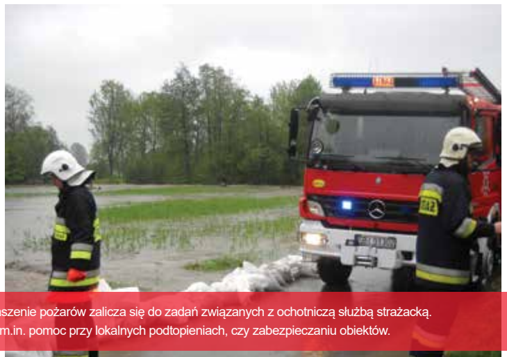
Nie tylko gaszenie pożarów zalicza się do zadań związanych z ochotniczą służbą strażacką. To również m.in. pomoc przy lokalnych podtopieniach, czy zabezpieczeniu obiektów.