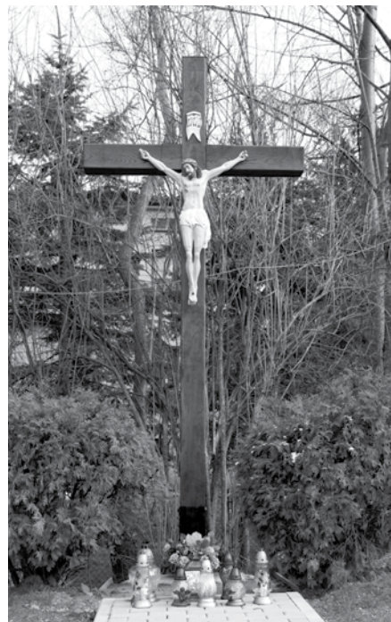
Krzyż drewniany przy ul. Beskidzkiej, wotum przetrwania zarazy w 1806 r.