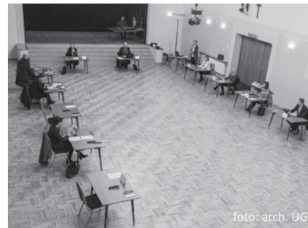
Marcowa sesja Rady Gminy odbyła się w sali Domu Kultury – zagrożenie epidemiologiczne sprawiło, że radni i przedstawiciele Urzędu Gminy byli tym razem oddaleni od siebie o kilka metrów

Wszystkie uchwały podjęte na sesjach Rady Gminy oraz materiały będące przedmiotem obrad dostępne są na stronie internetowej Biuletynu Informacji Publicznej Gminy Kozy www.bip.kozy.pl . (BRG)