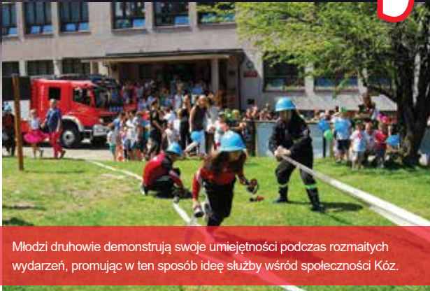
Młodzi druhowie demonstrują swoje umiejętności podczas rozmaitych wydarzeń, promując w ten sposób ideę służby wśród społeczności Kóz.