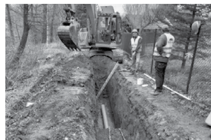
W ramach zadania 4 prace związane z budową kanalizacji sanitarnej prowadzone są m.in. w ulicy Złotej

W celu uzyskania większej ilości informacji na temat Projektu oraz szczegółów dotyczących realizacji poszczególnych zadań zapraszamy wszystkich zainteresowanych, do biura Jednostki Realizującej Projekt (JRP) mającego siedzibę w budynku Urzędu Gminy Kozy na II piętrze, pokój 23 lub do odwiedzenia strony internetowej www.kozy.pl/jrp