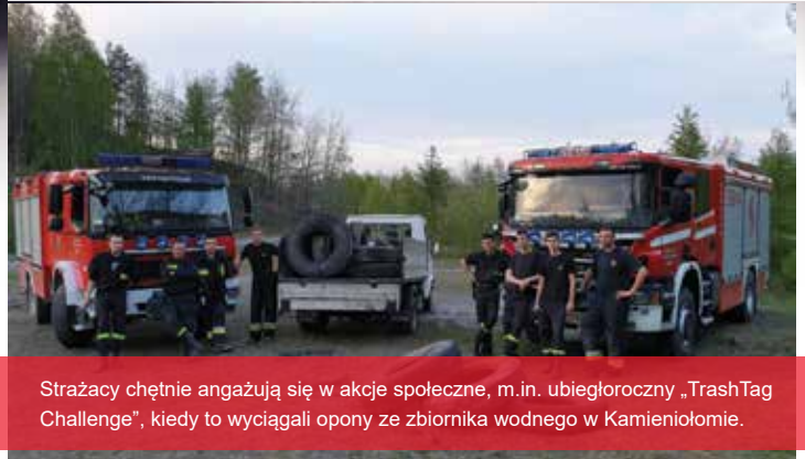
Strażacy chętnie angażują się w akcje społeczne, m.in. ubiegłoroczny „TrashTag Challenge”, kiedy to wyciągali opony ze zbiornika wodnego w Kamieniułomie.