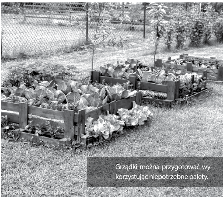
Grządki można przygotować wykorzystując niepotrzebne palety.