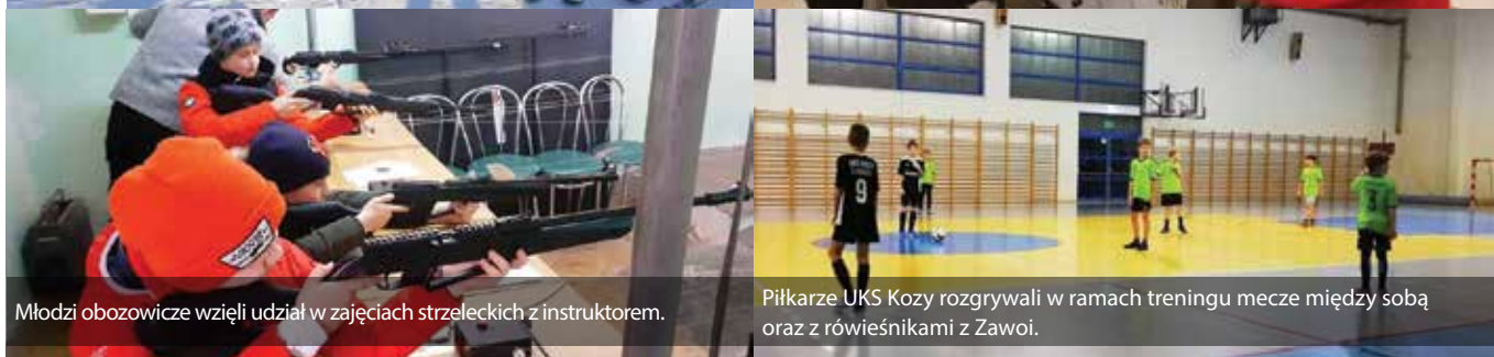
Młodzi obozowicze wzięli udział w zajęciach strzeleckich z instruktorem.