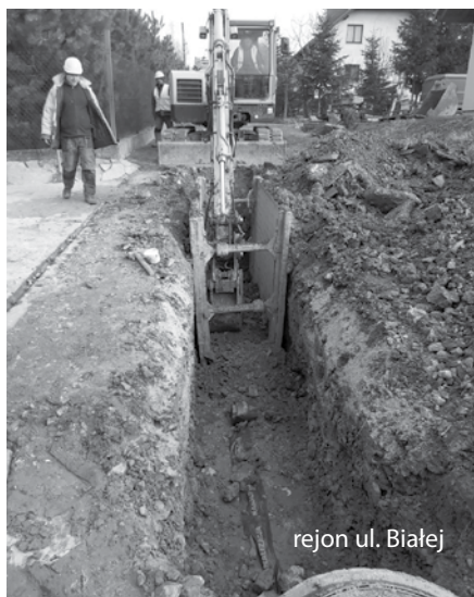
rejon ul. Białej

Informacji na temat projektu oraz szczegółów dotyczących realizacji poszczególnych zadań udzielają pracownicy biura Jednostki Realizującej Projekt (JRP) w Urzędzie Gminy Kozy, II piętro, pokój 23, strona internetowa www.kozy.pl/jrp (ug)