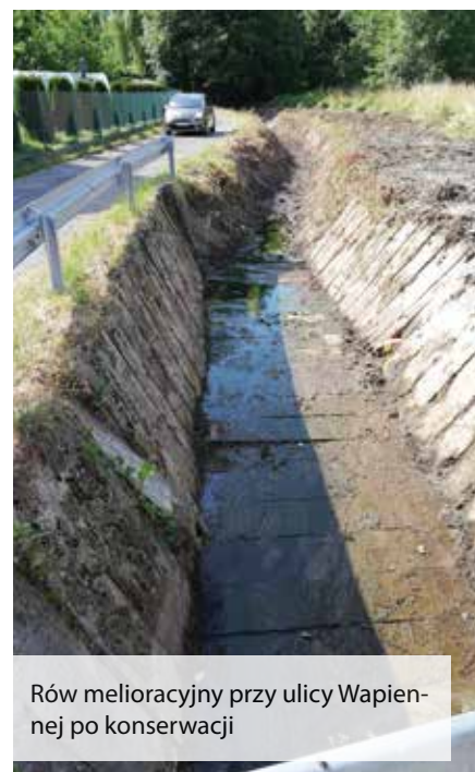
Rów melioracyjny przy ulicy Wapiennej po konserwacji