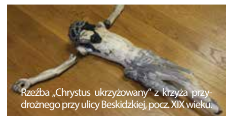
Rzeźba „Chrystus ukrzyżowany” z krzyża przydrożnego przy ulicy Beskidzkiej, pocz. XIX wieku.

W oparciu o zebraną wiedzę nt. rękodziełnictwa i sztuki artystycznej zostanie opracowana gra terenowa, która ma na celu zainteresowanie najmłodszych historią, etnografią, tradycją swoich przodków. Na jej podstawie powstanie wirtualny spacer śladami elementów artystycznych w przestrzeni Kóz, który będzie dostępny na stro-