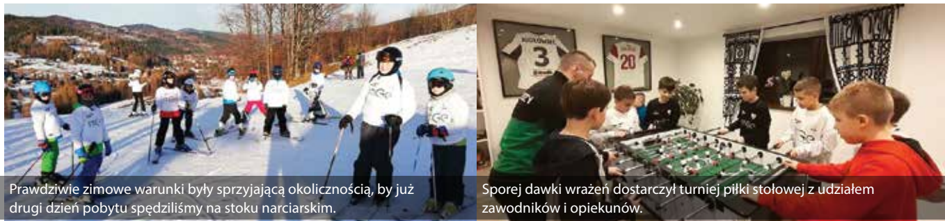
Prawdziwie zimowe warunki były sprzyjającą okolicznością, by już drugi dzień pobytu spędziliśmy na stoku narciarskim.

– Do Kóz przywieźliśmy ze sobą mnóstwo wspaniałych wspomnień i niezapomnianych chwil, o które zadbali podopieczni wraz z opiekunami – tak w dużym skrócie tygodniowy zimowy obóz w Zawoi podsumowuje UKS Kozy. Poniżej zdjęcia z udanego wypoczynku.