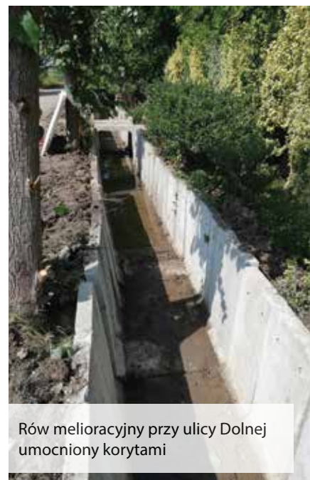
Rów melioracyjny przy ulicy Dolnej umocniony korytami