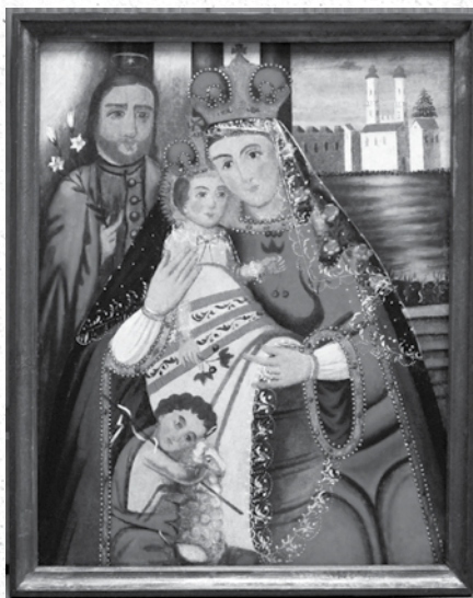
Obraz „Matka Boska Dzikowska” ze zbiorów Izby Historycznej (poł. XIX w.)

W XIX wieku wykształcił się zawód tzw. obraznika, czyli rzemieślnika trudniącego się masowym malowaniem obrazów o treści religijnej. Warsztaty „obrazników” skupione najczęściej w ośrodkach pielgrzymkowych oraz miastach, wykonywały w wielu egzemplarzach wizerunki świętych techniką rzemieślniczą. Równocześnie „obraznicy” zajmowali się wędrownym handlem wytworzonych przez siebie dzieł. Izba Historyczna im. Adolfa Zuberera posiada kilka tego typu obrazów, pochodzących z koziańskich chałup. Jednym z cenniejszych egzemplarzy jest wizerunek Matki Boskiej Dzikowskiej. Koziański przykład przedstawia Maryję z Dzieciątkiem Jezus na rękach, które podaje Maryi kwiat. W tyle stoi św. Józef z lilią, a w dolnej części obrazu św. Jan Chrzciciel, przedstawiony