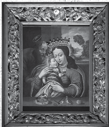
Obraz „Matki Bożej Dzikowskiej” z kościoła dominikanów w Tarnobrzegu (XVI w.)

jako dziecko, trzymające baranka. Postacie znajdują się wewnątrz jakiegoś pomieszczenia, na tle okna, przez które widać mury miasta.