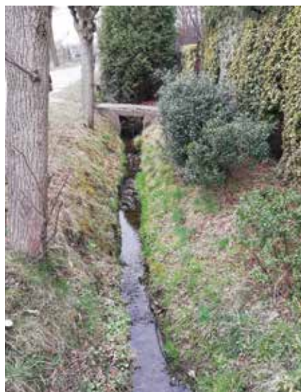
Rów melioracyjny przy ulicy Dolnej przed pracami