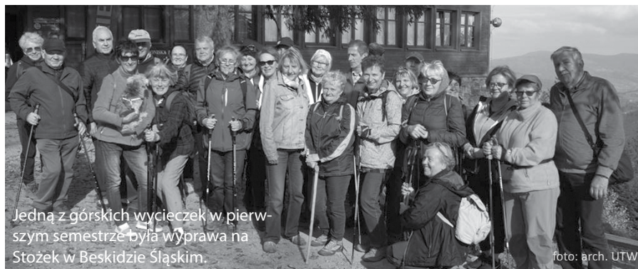
Jedną z górskich wycieczek w pierwszym semestrze była wyprawa na Stożek w Beskidzie Śląskim.