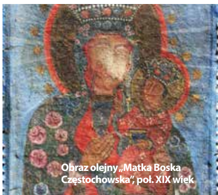
Obraz olejny „Matka Boska Częstochowska”, poł. XIX wiek

Stowarzyszenie „Region Beskidy” przyznało Gminnej Bibliotece Publicznej w Kozach dofinansowanie na realizację projektu „Kojzkie perelki w malarstwie i rzeźbie pogranicza polsko-słowackiego”. Wartość złożonego przez nas wniosku wynosi 84 189,23 zł, z czego 10% kwoty pokryje biblioteka ze środków własnych, a 5% budżet Państwa.