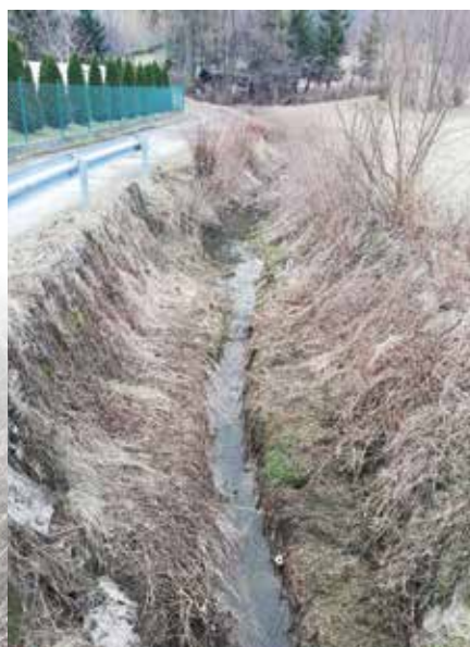
Rów melioracyjny przy ulicy Wapiennej przed pracami