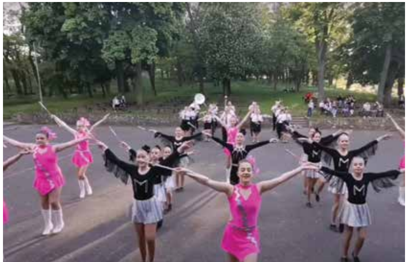
Wśród zespołów swoje umiejętności prezentowały także mazuretki - na zdjęciu kadr z nagrania zespołu BIG BANG Gostyń.