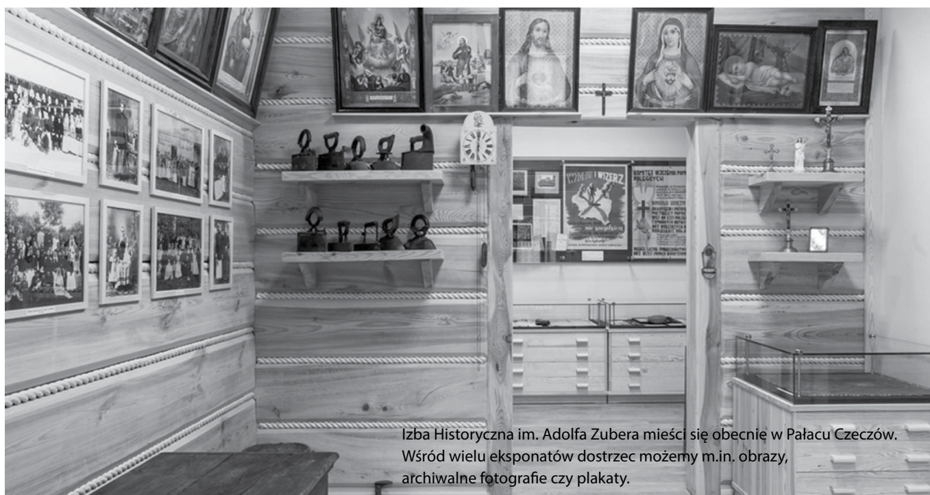
Izba Historyczna im. Adolfa Zuber mieści się obecnie w Pałacu Czechów. Wśród wielu eksponatów dostrzec możemy m.in. obrazy, archiwalne fotografie czy plakaty.