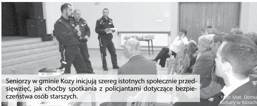
Seniorzy w gminie Kozy inicjują szereg istotnych społecznie przedsięwzięć, jak choćby spotkania z policjantami dotyczące bezpieczeństwa osób starszych.