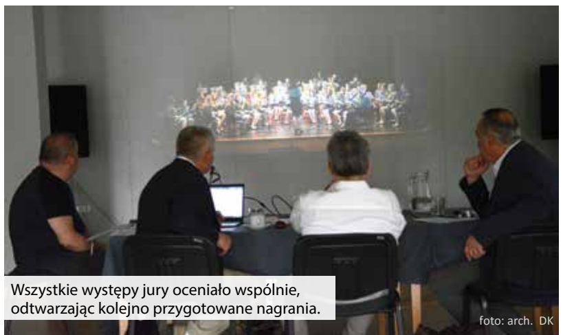
Wszystkie występy jury oceniało wspólnie, odtwarzając kolejno przygotowane nagrania.