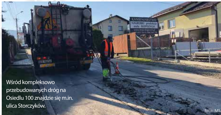
Wśród kompleksowo przebudowanych dróg na Osiedlu 100 znajdzie się m.in. ulica Storczyków.

Drugą z realizowanych inwestycji będzie kanalizacja deszczowa w ciągu ulicy Żłotej. – Intensywne opady deszczu niejednokrotnie doprowadzały do małych podtopień, zalewania piwnic czy ogrodów – obrazuje Jacek Kaliński. Projekt zakłada wykonanie wylotu kanalizacji