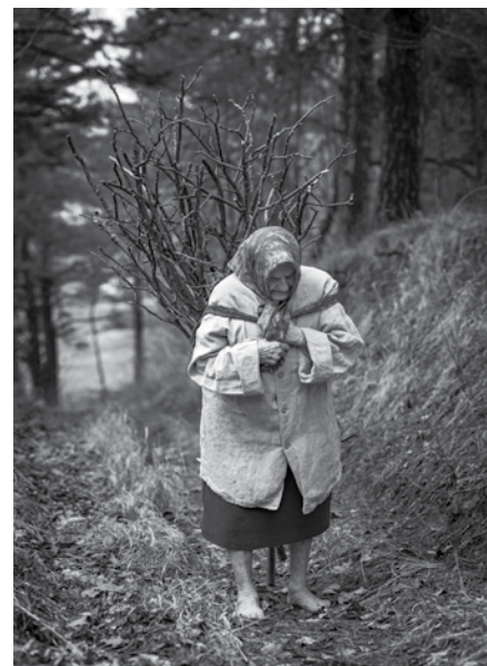
Z plecówką.

kalnie suche gałęzie) zajmowały się głównie kobiety i dzieci. Aby przetransportować wiązkę chrustu z zagajnika bądź lasu do domu, konstruowano tzw. plecówkę , którą – jak nazwa wskazuje – niesiono na plecach. Należy dodać, że pozyskiwanie drewna z lasu na zboczu Hrobaczej Łąki, w tym także chrustu, było możliwe wyłącznie za zgodą właściciela tego terenu, którym był Obszar Dworski. W zarządzie majątku dworskiego lub u leśniczego można było wykupić zgodę na zbiórkę