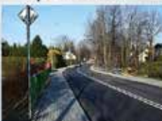
drogi i chodniki