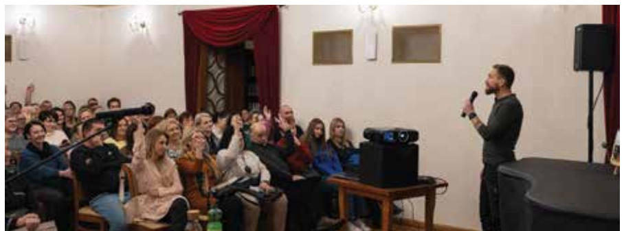
Sporo humoru, zabawnych aneddot, ale i opowieści przyprawiających o dreszcze. Publiczność chętnie podejmowała się również dyskusji.