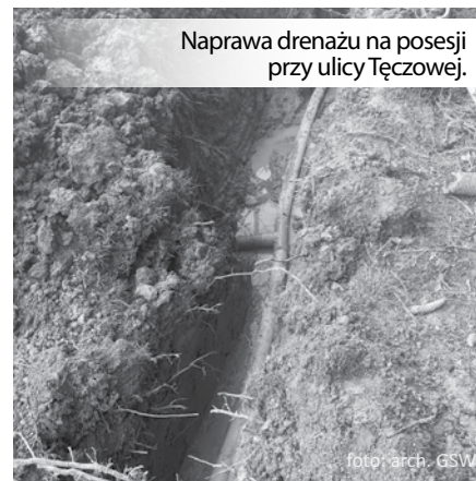
Naprawa дренаżu na posesji przy ulicy Tęczowej.