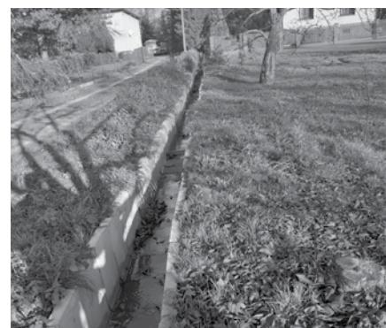
Umocniony rów melioracyjny znajdujący się przy ulicy Podgórskiej.