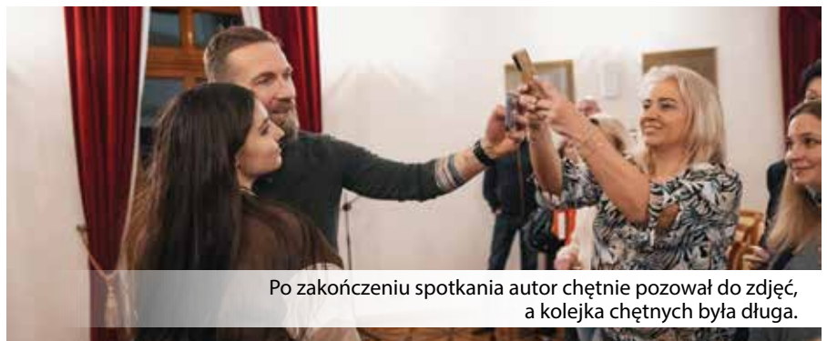
Po zakończeniu spotkania autor chętnie pozował do zdjęć, a kolejka chętnych była długa.